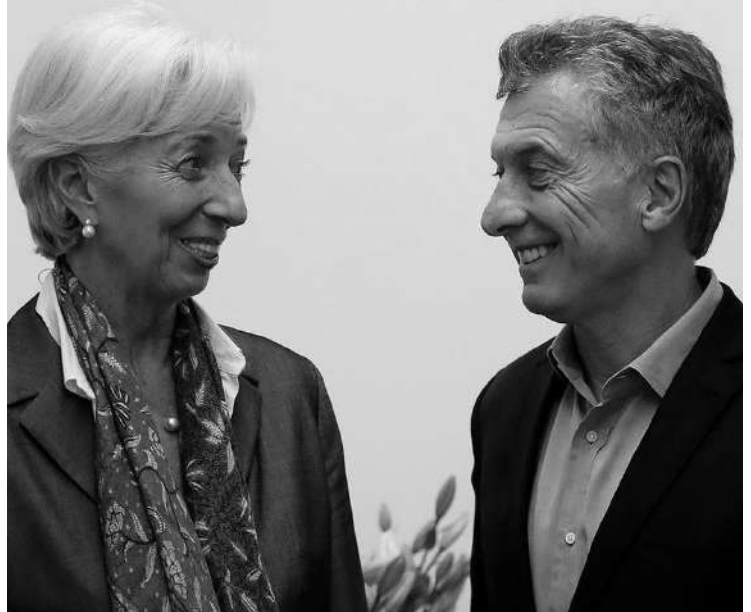
VISITA: EN MARZO DE ESTE AÑO, LAGARDE SE REUNIÓ CON MACRI.

El gobierno no pudo con el dólar. Dejó la emisión de letras y recurre al crédito del organismo internacional.