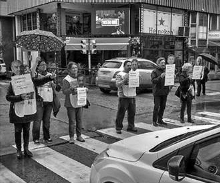
INTERVENCION: LA PROTESTA SE REALIZO POR EL CENTRO DE LA CIUDAD.

Los docentes universitarios realizaron paros y actividades públicas.