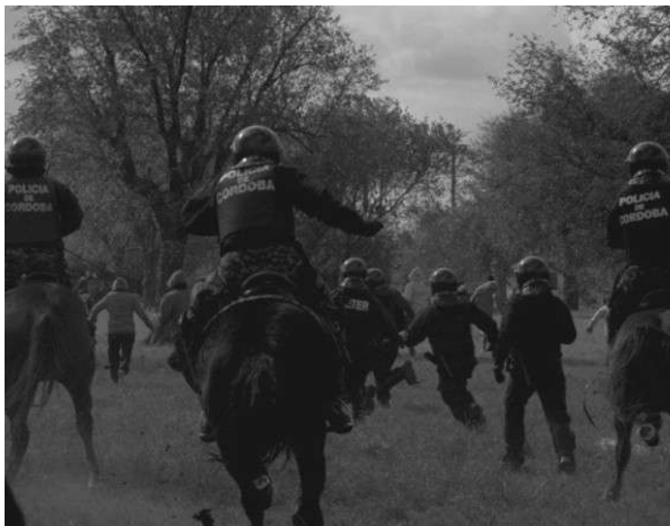
DE CACERÍA. CABALLERÍA PERSIGUIENDO VECINOS EL PASADO VIERNES