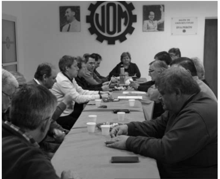
PLENARIO. RECLAMARON DESDE REGIONALES MEDIDAS A CGT NACIONAL.

Secretarios generales de gremios de CGT, definieron realizar un urgente plan de lucha con regionales de Córdoba. Cuestionaron el acuerdo con FMI y la pasividad del triunvirato.