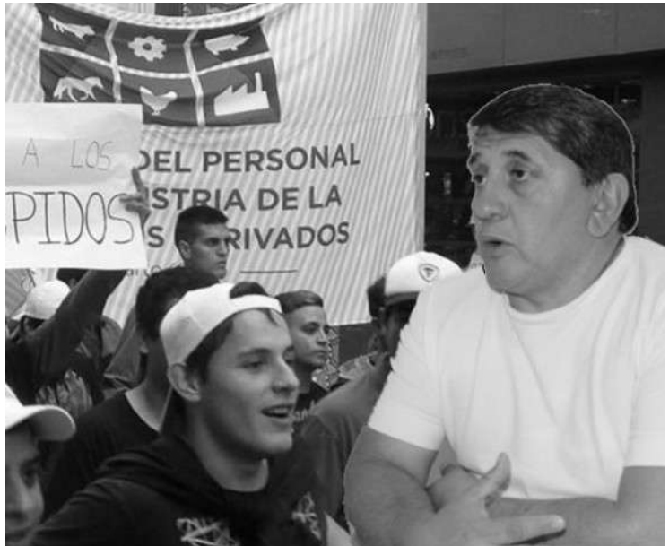
OVIEDO: "LA SITUACIÓN EN CARNES BLANCAS ES ALARMANTE".

ya que “les que permite, implementando el Artículo 247, hacer despidos al 50 por ciento”, explicó Oviedo. “Vamos a pelear ese porcentaje y también el requerimiento de personal que quiere la empresa en su momento”, sostuvo. Destacó que hasta tanto no tengan en su poder la comunicación oficial del Ministerio de Trabajo no sabrán cuál es el pedido real de la cantidad de gente que la empresa decide prescindir.