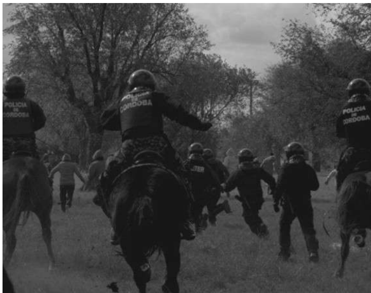
DE CACERÍA. CABALLERÍA PERSIGUIENDO VECINOS EL PASADO VIERNES