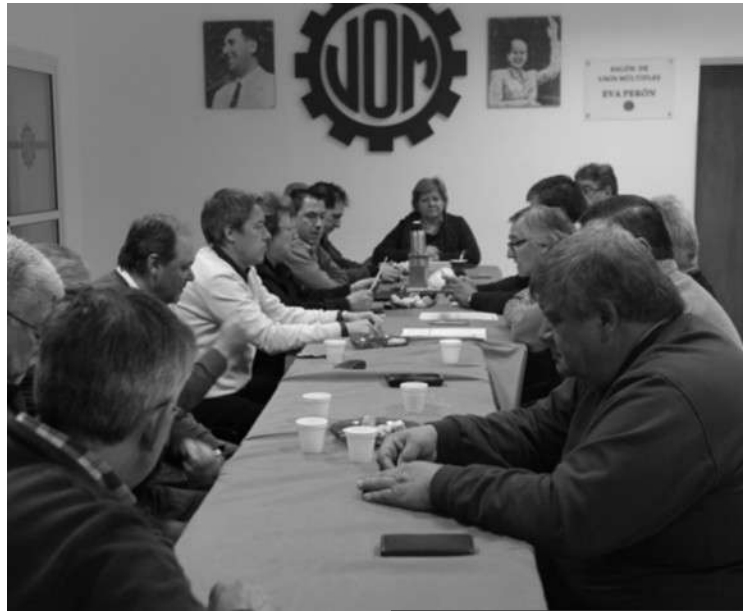
PLENARIO. RECLAMARON DESDE REGIONALES MEDIDAS A CGT NACIONAL.

Secretarios generales de gremios de CGT, definieron realizar un urgente plan de lucha con regionales de Córdoba. Cuestionaron el acuerdo con FMI y la pasividad del triunvirato.