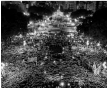
PAÑUELOS. DESPLEGADOS EN CABA.

El 3 y 4 de junio se realizaron multitudinarias concentraciones en las principales ciudades del país. El epicentro fue la marcha de “Ni una Menos” al Congreso de la Nación, en reclamo de la aprobación, el próximo 13 de junio en Diputados, del proyecto presentado por “la Campaña Nacional por el Aborto Legal, Seguro y Gratuito, ¡no otro!”, según explicitan en el documento principal de la movilización del 4J -completo en www.elmegafono.net -. Ese escrito, sin embargo, destacó otros dos puntos. Por un lado, el reclamo contra la política de endeudamiento de Mauricio Macri: “No al pacto con el FMI”, ni al “al pago de la deuda externa. Abajo el ajuste de Macri y los gobernadores. Basta de despidos, suspensiones y represión”. También estuvo presente la consigna inicial de la campaña en 2015: “#Ni Una Menos. Basta de femicidios. El Estado es responsable”.