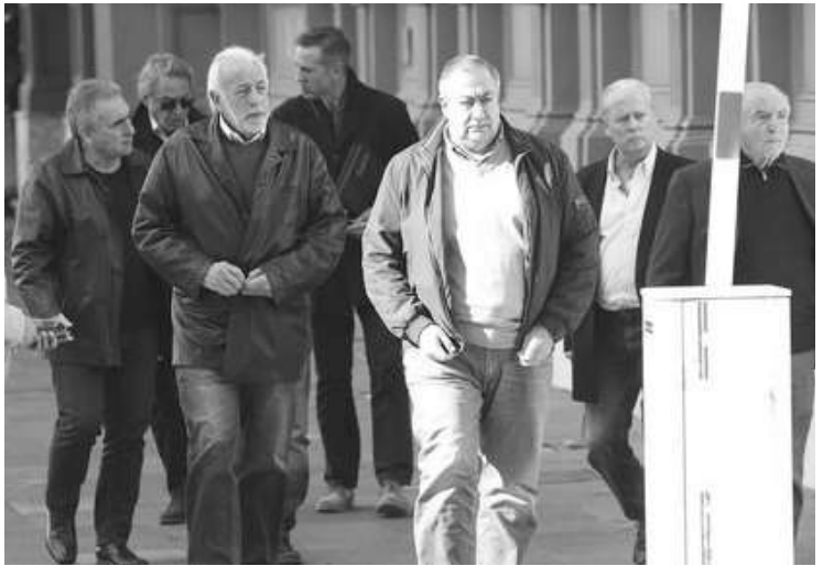
REUNION. DIRIGENTES DE LA CGT SALEN DE LA CASA ROSADA LUEGO DE ACORDAR CONTINUAR EL DIALOGO LA SEMANA PROXIMA.

Luego de la reunión con la "mesa chica" de la CGT, el ministro de Hacienda, Nicolás Dujovne, comunicó que el Presidente firmó un decreto mediante el cual se dispuso un trámite rápido de renegociación salarial de entre el 2,5 y 5% de aumento en julio y agosto, a cuenta de las cláusulas de revisión de aumentos previstas para septiembre. Adelantó que acordaron con la CGT continuar el diálogo el martes próximo. Posteriormente, en el brindis por el Día del Periodista, el presidente Mauricio Macri dijo que "ya firmé el decreto puente que el Gobierno le ofreció a la CGT para facilitar el aumento salarial del 5 % para los meses