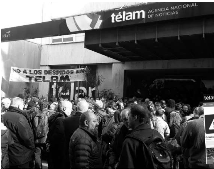
SEDE DE TELAM: LOS TRABAJADORES EN ASAMBLEA Y MOVILIZADOS.

La agencia pública de noticias quedó desguazada. Los trabajadores dicen que el gobierno entrega "el sistema de medios en favor del capital concentrado".