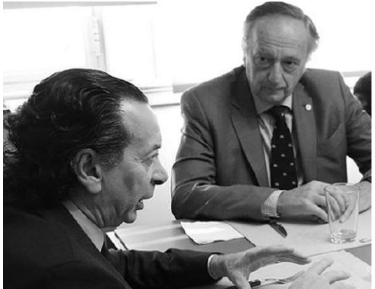
GESTOS CON LA UIA: SICA CON ACEVEDO, DE AGD Y PRESIDENTE DE UIA.

La deuda externa aumentó, en el primer trimestre del año, en 54.873 millones de dólares, lo que equivalió a un incremento del 27,5% en forma interanual.