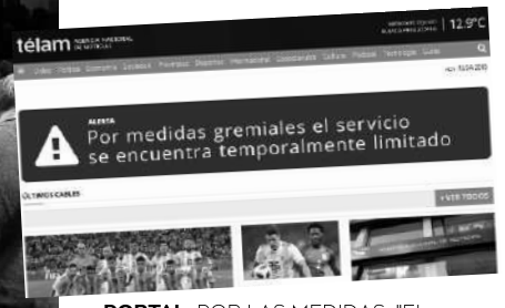
PORTAL: POR LAS MEDIDAS, "EL SERVICIO SE ENCUENTRA LIMITADO"

Hoy en Córdoba, el CISPREN, junto a la Facultad de Comunicación y centros de estudiantes, realizarán un abrazo solidario. En Río Cuarto, también se suman a la medida.