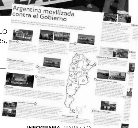
INFOGRAFIA. MAPA CON MOVILIZACIONES DEL PARO / P8-9

Empleo y producción, los principales reclamos. Lo multisectorial, la característica. Concentraciones, cortes de rutas y puentes signaron la jornada.