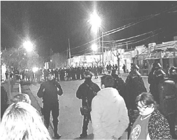
POLICIA EN CHUBUT: INFANTERÍA REPRIMIÓ CON GASES LACRIMÓGENOS.

Docentes en Chubut, estudiantes en la FUBA. La policía golpeó a militantes ante las protestas.