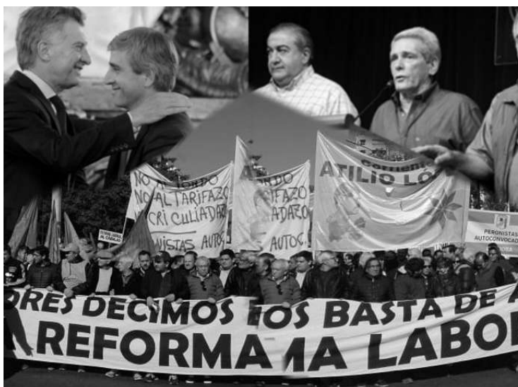
CENTRALISMO Y REGIONES. EL PARO FUE EN LA CALLE Y POR CAMBIO DE RUMBO.

El Paro se vivió en las calles del país. Políticas de empleo y producción, fueron los principales reclamos. El matiz multisectorial, la composición característica.