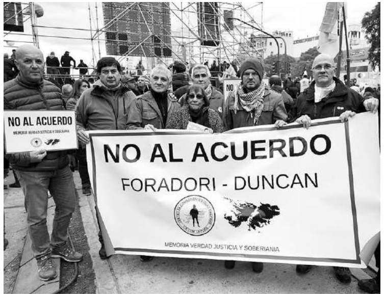
NO AL ACUERDO: LOS EX COMBATIENTES MARCHARON EL 9 DE JULIO.

Disputa en las Islas Malvinas por los recursos naturales. Y lo más importante: la puerta a la Antártida. Ex combatientes dicen que peligra la soberanía.