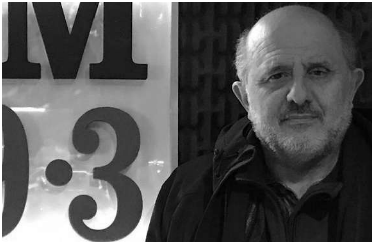
BROWN: “NO VEMOS LOS RIESGOS DE LA INTEGRIDAD TERRITORIAL”.

Dijo que la defensa nacional y la soberanía “incluye a las FFAA pero es mucho más amplia”.