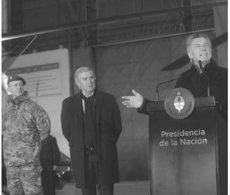
MACRI: JUNTO AL MINISTRO DE DEFENSA AGUAD Y MIEMBROS DE LAS FFAA.

Ninguna novedad para un gobierno que ya anunció la instalación de dos "task force" (fuerza operativa) en Salta y Misiones en conjunto con la