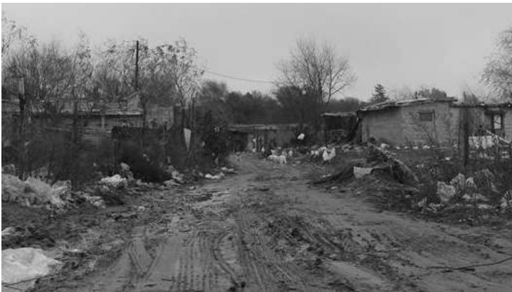
1578. ES LA CANTIDAD DE "VIVIENDAS POPULARES" CENSADAS EN RÍO CUARTO.

La coordinadora provincial estuvo en Río Cuarto y se reunió con instituciones. Esperan la aprobación de la Ley para urbanizar asentamientos, antes de fin de año.