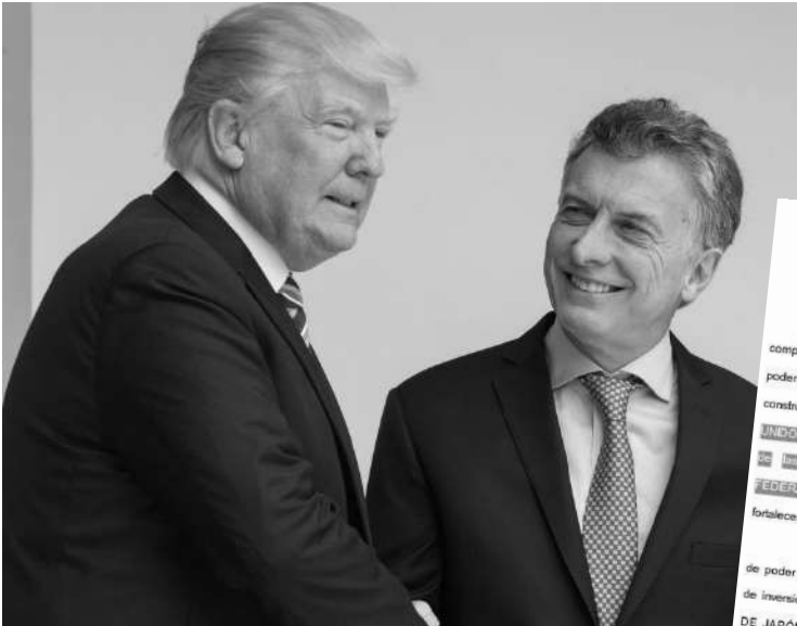
RESPALDO: TRUMP DEFENDIÓ LA GESTIÓN DE MACRI EN MEDIO DE LA CORRIDA CAMBIARIA DURANTE EL MES DE ABRIL DE ESTE AÑO.

Con otro decreto, el gobierno de Macri elige los mismos enemigos que el país del norte: China, Rusia y Venezuela. Pone a las Fuerzas en tareas de apoyo logístico a la seguridad e introduce el narcotráfico y el terrorismo como peligros.