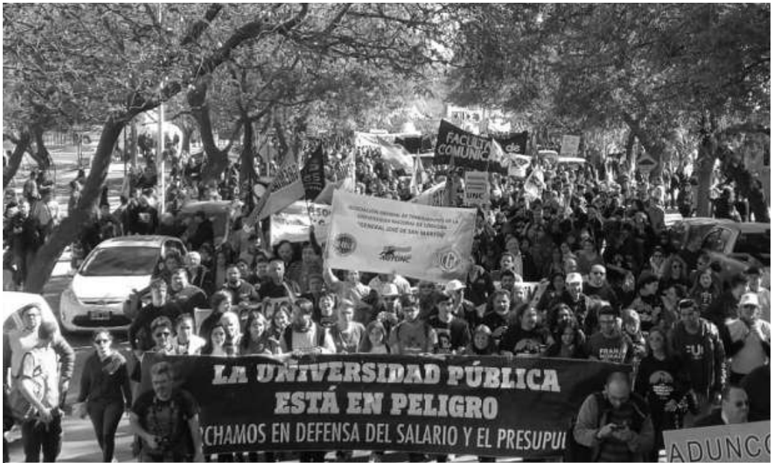
MULTITUD EN CÓRDOBA: 100 MIL PERSONAS SE MANIFESTARON EN LA UNC. EL RECTORADO FUE "TOMADO" UNAS HORAS.

Los docentes de las Universidades Nacionales llevan tres semanas de paro. Se multiplican las actividades públicas -clases, marchas- y las Asambleas en varias dependencias de todo el país resuelven la toma de los establecimientos.