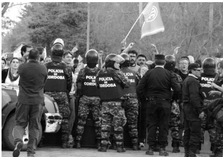
CUSTODIADOS. POLICÍA INTERVINO EN RÍO TERCERO Y GENDARMERÍA EN VILLA MARÍA

En el Congreso Nacional, ante un grupo de diputados y senadores los trabajadores presentaron una propuesta para "reimpulsar el proyecto de ley de responsabilidad social y