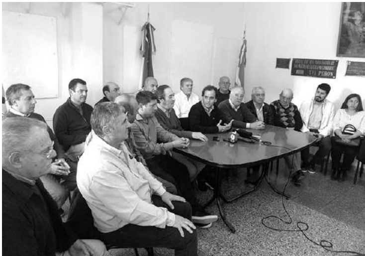
OBRAS. LOS INTENDENTES AFIRMARON QUE SE FRENARÁN LAS OBRAS PÚBLICAS.

Para el Gobierno Provincial el recorte de fondos "era la medida que menos resistencia generaba", sin embargo los intendentes peronistas lo rechazaron y sostuvieron que "profundizará la crisis". Fuertes críticas al Gobierno Nacional.