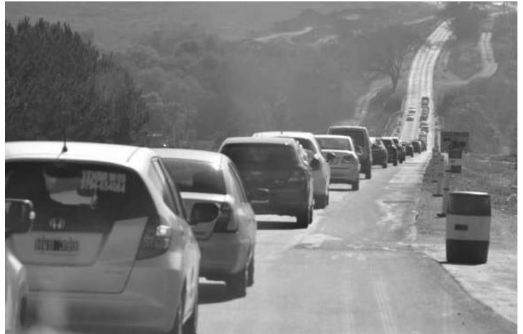
CARAVANA: 25 VEHÍCULOS Y DOS COMBI RECORRIERON LA PROVINCIA.

300 kilómetros de Posadas a la Triple Frontera en repudio a la injerencia externa y la militarización.