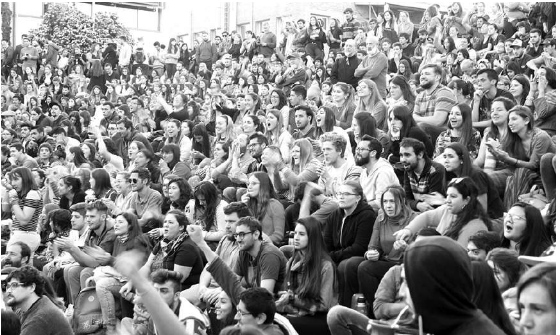
CONSIGNAS PARA HOY: MASIVO ACTO EN LA PLAZA Y CONTINUIDAD DEL PLAN DE LUCHA.

Estudiantes, Trabajadores, organizaciones y miles de vecinos se dieron cita en las asambleas y movilizaciones del campus y la ciudad. Se expresó, completa, la comunidad de Río Cuarto.