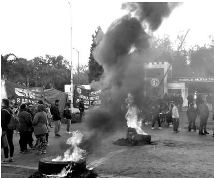
CORDON INDUSTRIAL ROSARIO: PARO, CORTE DE RUTA Y BLOQUEO DE ACCESO A LOS PUERTOS EN LA ZONA DONDE CIRCULA GRAN PARTE DE LA RIQUEZA DEL PAÍS.