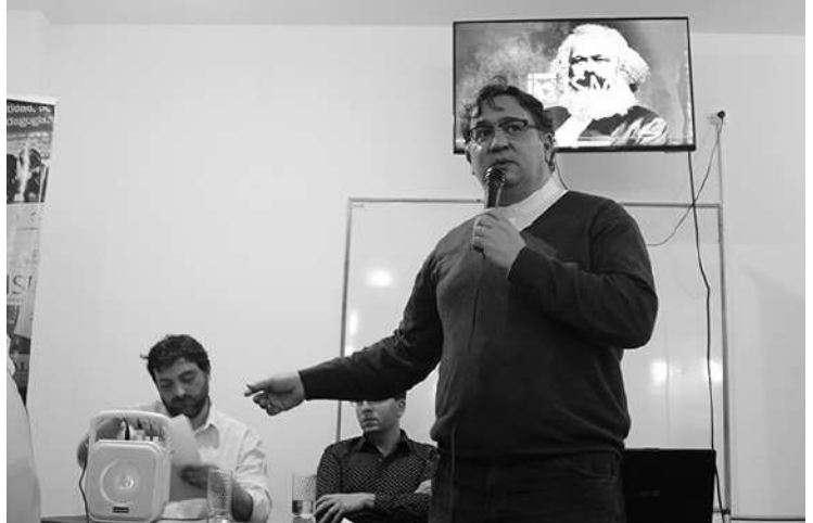
EN COMUN. LAS COINCIDENCIAS SON LAS LECTURAS DE LAS INJUSTICIAS.