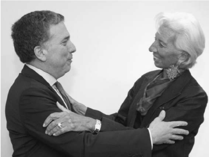
RECETA: TEL MINISTRO DE ECONOMÍA VIAJÓ A ESTADOS UNIDOS Y SE REUNIÓ CON LA PRESIDENTA DEL FMI CRISTINE LAGARDE.

Otra vez el mismo movimiento: corrida cambiaria seguida de ajuste. Macri achica los Ministerios. La industria está paralizada y los trabajadores más movilizados.