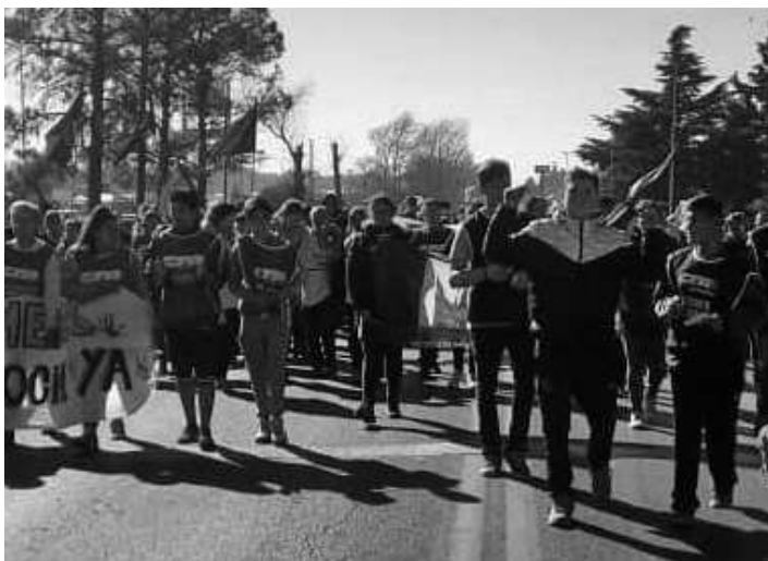
RIO CUARTO. GREMIOS, ESTUDIANTES Y MOVIMIENTOS SOCIALES PROTESTARON CON CORTES DE RUTA FRENTE A LA RURAL Y SOBRE LA RUTA 158.

Nueva devaluación del 20%, menos Ministerios, retenciones a las exportaciones. Las centrales obreras convocaron al paro. 20 Universidades tomadas, movilizaciones y cortes de rutas.