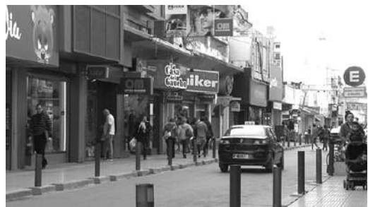
NUMEROS ROJOS INFORME DEL CECIS