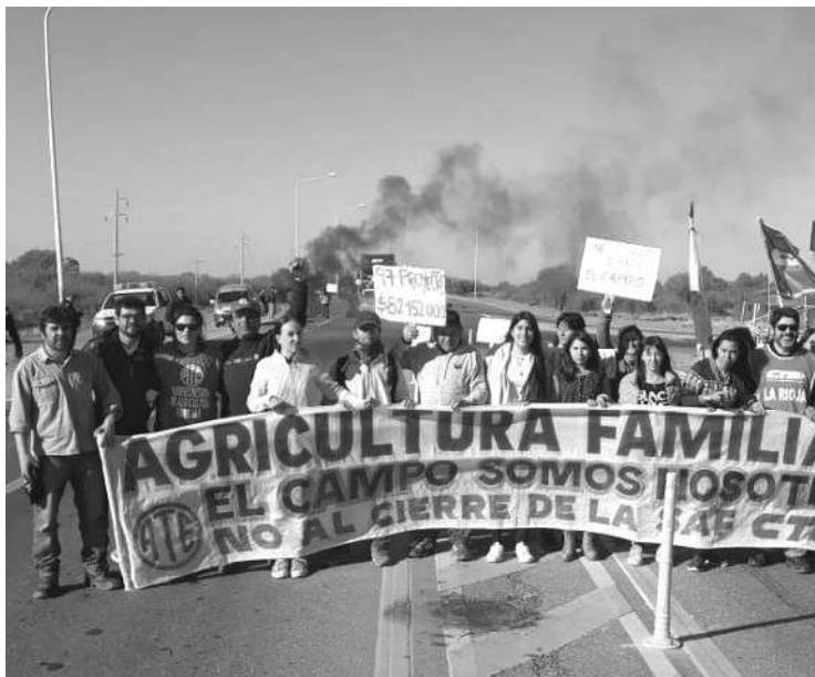
AGROINDUSTRIA: EL CORTE DE RUTA 38 EN LA RIOJA ACOMPAÑA LA TOMA DE LA SEDE CENTRAL EN BUENOS AIRES, POR LOS 547 NUEVOS DESPIDOS.