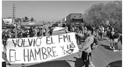
MACRI EN RIO CUARTO

Organizaciones sociales y sindicales -ATE, CTA, FURC, agrupaciones políticas- realizaron dos cortes durante la visita de Mauricio Macri en ruta 8, frente a Bio4 y en Ruta 156, frente al Área Material Río Cuarto en protesta "por la crisis económica, los tarifazos, el ajuste a la educación y salud pública".