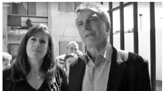
TIMBREO EN RIO CUARTO

Organizaciones sociales y sindicales -ATE, CTA, FURC, agrupaciones políticas- realizaron dos cortes durante la visita de Mauricio Macri en ruta 8, frente a Bio4 y en Ruta 156, frente al Área Material Río Cuarto en protesta "por la crisis económica, los tarifazos, el ajuste a la educación y salud pública".