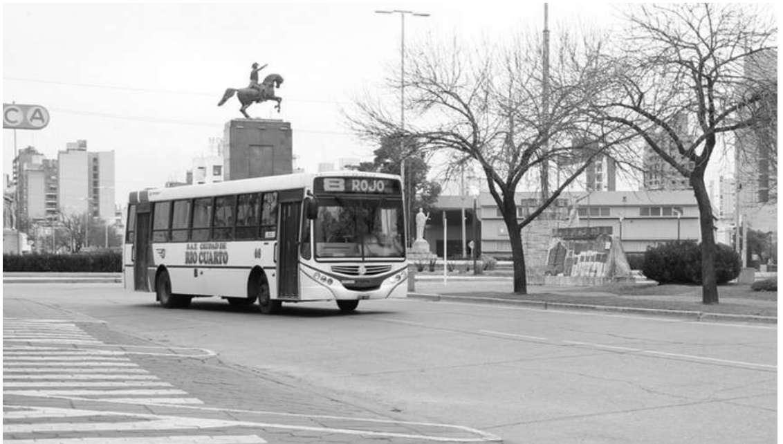
MENOS FRECUENCIA. LA SALIDA SOLICITADA POR LA EMPRESA. EL BOLETO A $50 -SIN SUBSIDIO- ES "INVIABLE" PARA LA SAT.

Eliminación de subsidios nacionales en 2019, devaluación del dólar y una "recesión" que disminuye la cantidad de usuarios, los problemas que manifiesta la empresa.