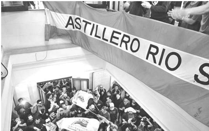
SOLICITUD: LOS TRABAJADORES PIDEN INSUMOS PARA VOLVER A TRABAJAR.

La gobernadora María Eugenia Vidal reconoció el pedido de los trabajadores tras la firma del acta acuerdo.