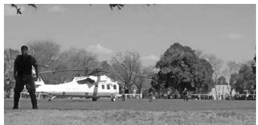
"YO HAGO TAREAS SOCIALES, VEO LO QUE PASA"

El presidente volvió a encontrarse con una vecina de barrio Abilene. Por la situación económica, "Como clase media trabajadora me he visto muy perjudicada", comentó la señora a Macri según describió el diario La Voz. Además le deseó "fuerza" y que siga "adelante". "¡Viste Mauricio como me ajusté!", le dijo al presidente, que respondió sonriendo: "Me parece muy bien".