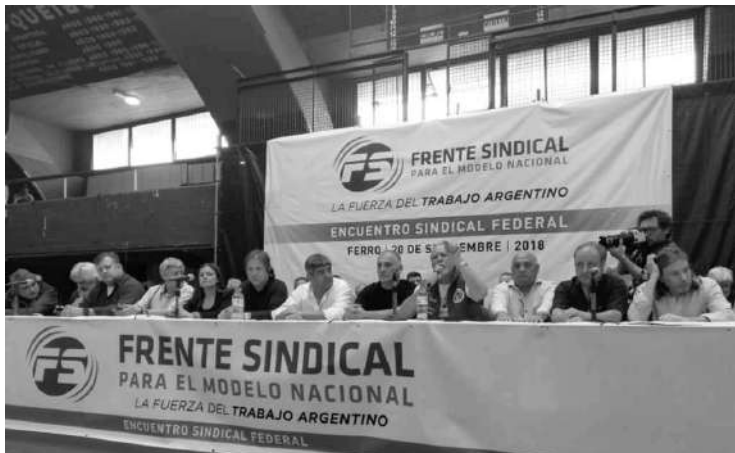
CONTRAPUNTO. GREMIOS LANZAN CORRIENTE INTERNA DE CGT PREVIO AL PARO.

El movimiento obrero realizará dos jornadas de lucha. En Río Cuarto se realizarán actividades, aunque CGT convocó a no movilizar.