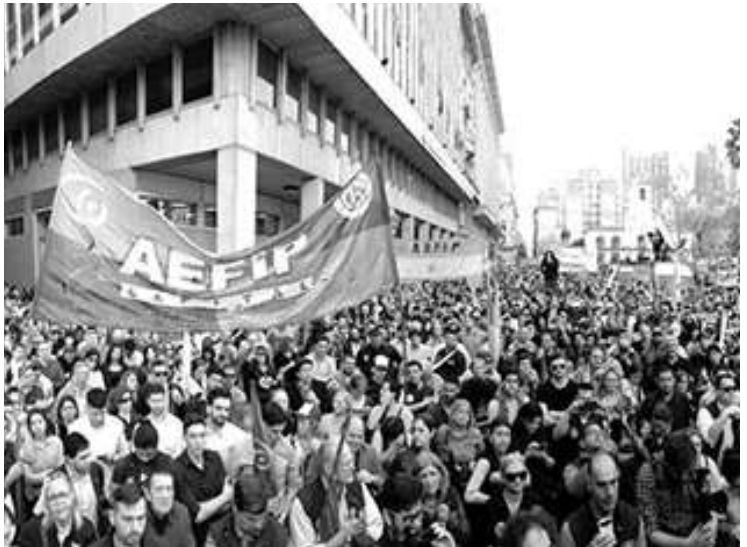
PROTESTA. HABRA CORTES DE ATENCION AL PUBLICO Y TAREAS OPERATIVAS.

“Esta rebaja es ilegal y la estamos discutiendo en la Justicia. Más allá de esto queremos que