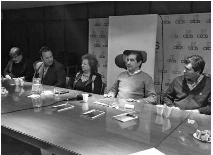
RENTA LOCAL: "LA RENTA VA A PARAR AL SISTEMA FINANCIERO BANCARIO "

También apuntaron sobre la renta de la producción local. En la investigación publicada "vemos que esa renta va a parar al sistema financiero bancario, y no se ve reflejado en actividades productivas", citó