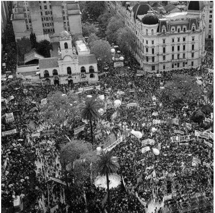
MASIVAS. LAS MOVILIZACIONES EN BUENOS AIRES, CORDOBA Y RIO CUARTO.

En Río Cuarto, sin embargo, se movilizó masivamente el martes con la participación de CTA, MAP, CTEP, FURC, Asamblea