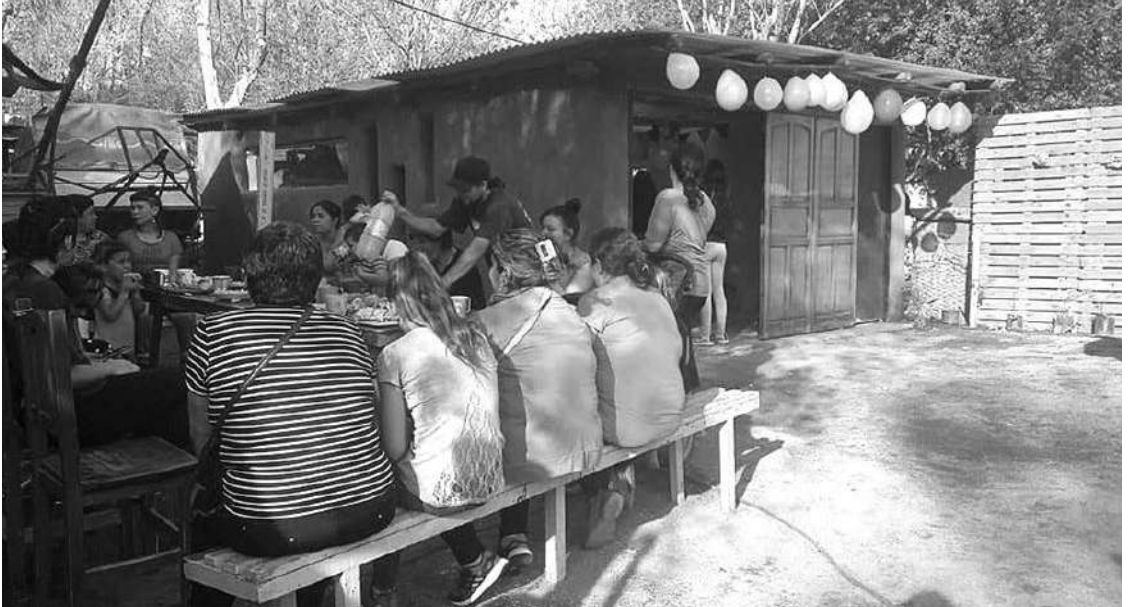
BIO CONSTRUCCION. LA OBRA DURO 8 MESES Y FUE REALIZADA POR VECINOS, NIÑOS E INTEGRANTES DE LOS ORILLAS.

En la costa del río inauguraron su salón hecho por bio construcción. Allí, desarrollarán actividades educativas, recreativas, microemprendimientos, y sobretodo, contención para cambiar la realidad del barrio.