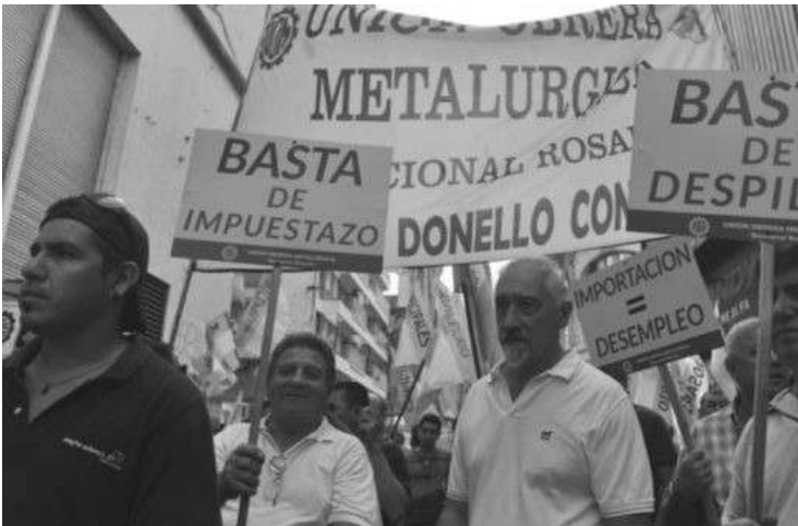
ADIMRA Y TRABAJO. LA MOVILIZACION INCLUYO A LA CAMARA Y LA SECRETARIA.

Marcharon el martes para reclamar la reapertura de las paritarias y exigir un aumento del 40% para 2018.