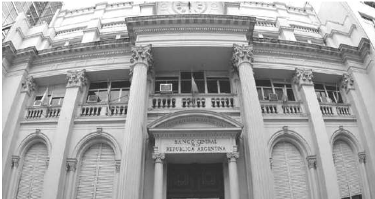
BCRA: NUEVAMENTE AUMENTO TASAS PARA RENOVAR LEBAC.

26.143 millones de pesos ganancias en agosto. El mayor rubro fue en letras del Banco Central.