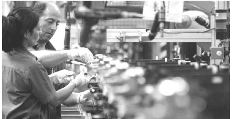
CAPACIDAD INSTALADA: CUARTO MES CONSECUTIVO QUE CAE.

En agosto cayó la actividad industrial y la capacidad instalada. También la construcción en septiembre.