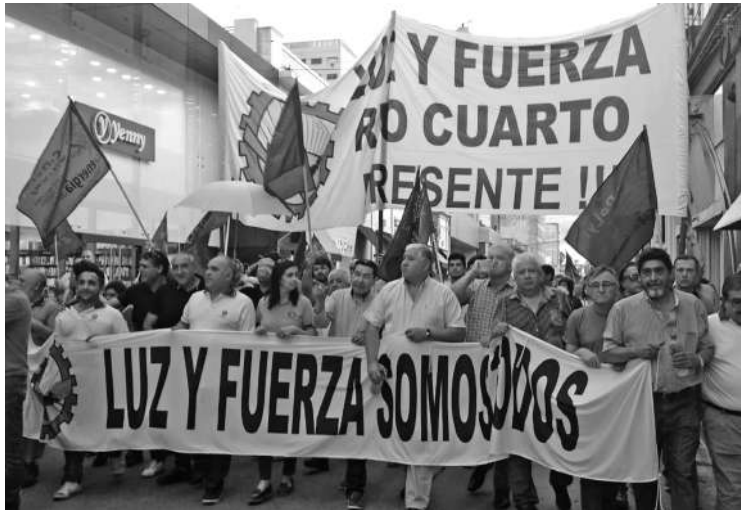
LUZ Y FUERZA: EL GREMIO DENUNCIA QUE SCHIARETTI PRIVATIZA EPEC A TRAVÉS DE LA TERCERIZACIÓN DE ALGUNOS SECTORES DE LA EMPRESA DE ENERGÍA.