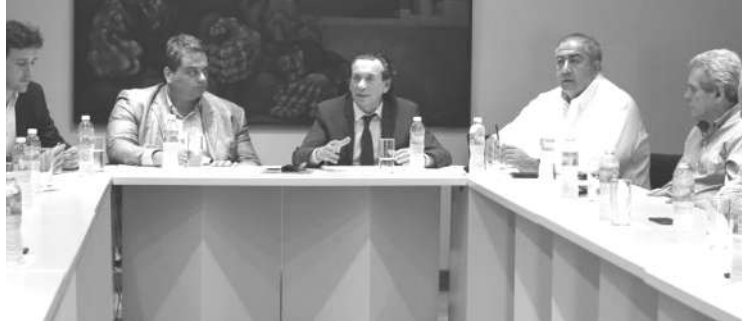
SICA: AUN NO SE PUSIERON DE ACUERDO COMO SE IMPLEMENTARIA EL BONO.

Sería de 5.000 pesos en dos cuotas. Los empresarios dicen que no pueden, los estatales lo quieren.