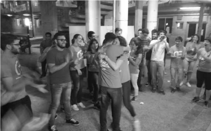
VICTORIA NARANJA. LA AGRUPACION ESTUDIANTIL CELEBRO PASADAS LAS 20.

Es la agrupación alentada por un sector de docentes y que se opuso al plan de lucha y la toma de la UNRC.