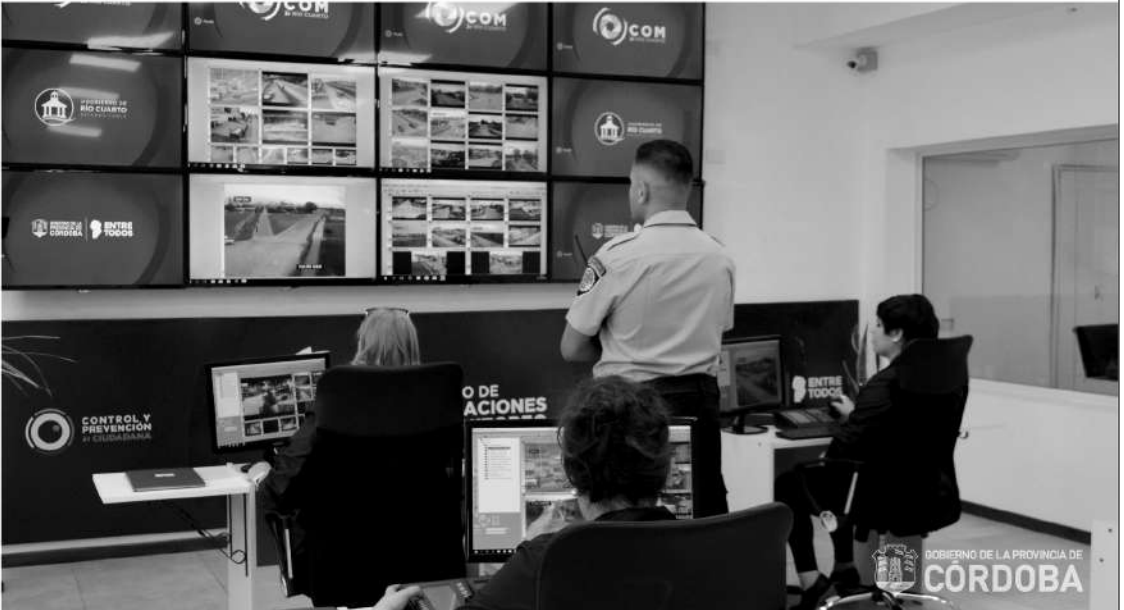
Este Centro es clave para la disuasión de la delincuencia, la prevención y la investigación de cualquier hecho delictivo

La capital alterna de la provincia implementó un sistema de seguridad y prevención de hechos delictivos. Además, Juan Schiaretti anunció que el Parque de los Azudes llevará el nombre "Gobernador José Manuel de la Sota" y entregó aportes a familias y emprendedores del sur provincial.