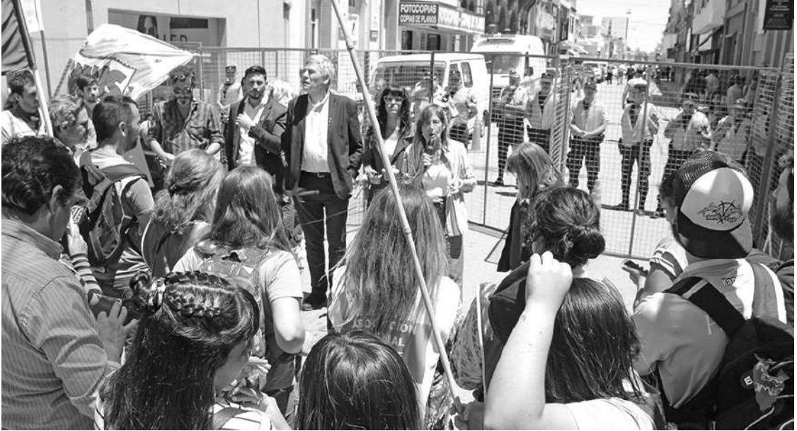
EN LA CALLE: LEGISLADORES DE LA OPOSICIÓN (MENOS CAMBIEMOS) SALIERON A RECIBIR EL PETITORIO.

Un amplio operativo de seguridad que custodió la sesión de legisladores impidió que vecinos, organizaciones sociales y sindicales pudieran acceder hasta la Sociedad Italiana para entregar un petitorio. Algunos legisladores salieron a recibirlos.