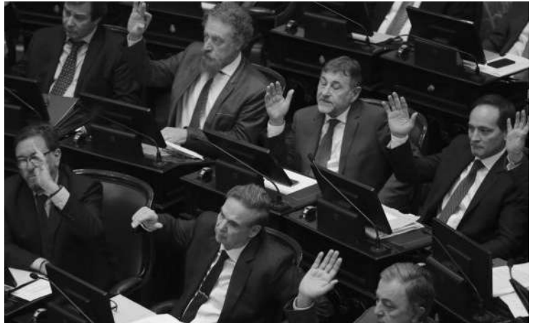
PICHETTO Y VARIOS MAS. LOS SENADORES OPOSITORES APROBARON LA NORMA

Pichetto dijo que a diferencia de lo que ocurrió cuando el presupuesto se trató en Diputados, "las masas de la