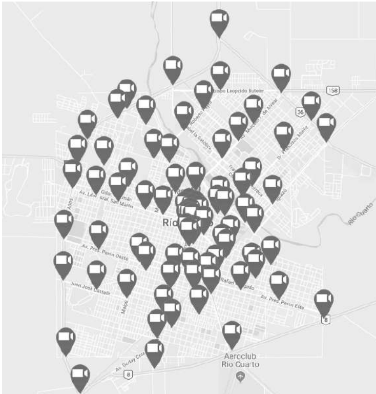
UBICACIONES: MAPA COMPLETO DISPONIBLE EN WWW.ELMEGAFONO.NET .