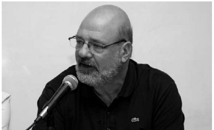
CONALBI: "EL PAPEL PARA DIARIOS AUMENTO 120 POR CIENTO ESTE AÑO"

La ley vigente -sostuvo Conalbi- tiene como objetivo "garantizar para todos los medios gráficos de papel el vital insumo para la prensa gráfica en igualdad de precios, accesibilidad y calidad". Además, "en un escenario de producción monopólica no hay mercado que regule".