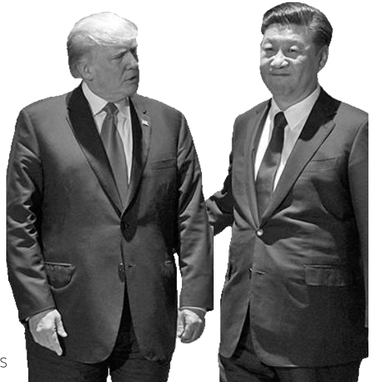
LIDERES: TRUMP Y XI XINPING, PRESIDENTES DE EEUU Y CHINA.

Reunión de líderes para buscar consensos. La guerra comercial en el centro de la escena.