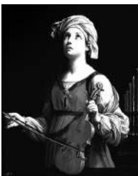
SANTA CECILIA. PATRONA DE LA MÚSICA.

"Soy un cantor de artes olvidadas que camina por el mundo para que nadie olvide lo que es inolvidable: la poesía y la música tradicional de Argentina". Atahualpa Yupanqui