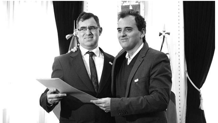
LLAMOSAS Y ANTONIETTI. EL EJECUTIVO SOLICITO EL NUEVO ENDEUDAMIENTO.

El “Convenio de Asistencia Financiera” suscripto con el Gobierno de la Provincia de Córdoba se da en el marco del