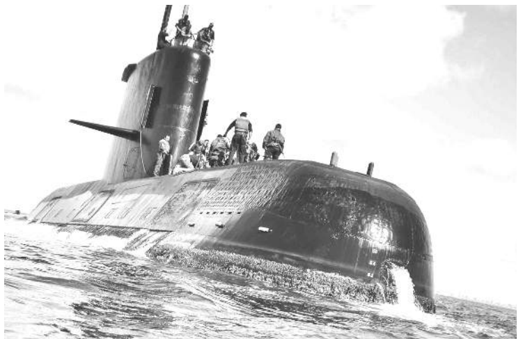
HUNDIMIENTO: "HAY QUE INVESTIGAR TODAS LAS HIPOTESIS", DIJO ODARDA.

Pero llama también la atención que la empresa contratada por el gobierno en agosto (Ocean Infinity), había anunciado días antes de encontrar el submarino que el 16 de noviembre abandonaría la