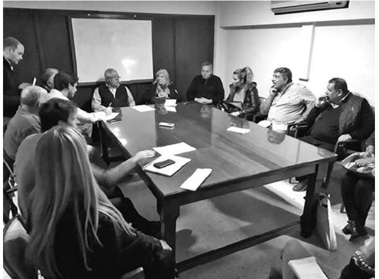
PREOCUPACION: EL PASADO MARTES 26, LAS CAMARAS EMPRESARIALES DEL CECIS SE REUNIERON PARA EVALUAR LA CAIDA EN LA ACTIVIDAD ECONOMICA.

En Río Cuarto, los empresarios reúnen a sus trabajadores y organizan un reclamo por mejores condiciones para la producción. "El único sector que está en mejores condiciones es el financiero", expresan y piden por cambio de modelo.