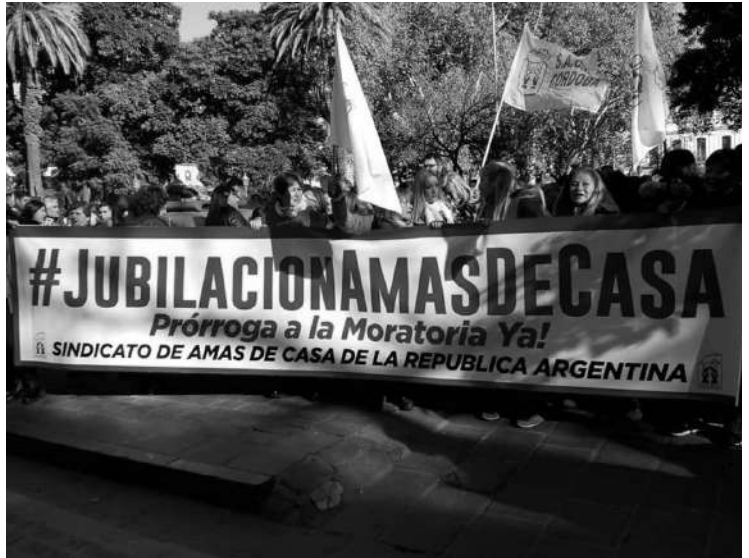
MOVILIZACIÓN: UN CENTENAR DE MUJERES ACOMPAÑÓ LA ENTREGA DEL PROYECTO EN CÓRDOBA CAPITAL. PRESENCIA DEL SINDICATO DE RÍO CUARTO.

El Sindicato de Amas de Casa de la República Argentina (SACRA) reclamó el pasado lunes frente a las oficinas de Anses Nacional (y en varias delegaciones del interior, como la de Córdoba capital) por la prórroga de la moratoria a las jubilaciones para las mujeres de más de 60 años que no contasen con 30 años de aportes al 23 de junio próximo (ver "Reparación Histórica"). Esta acción emprendida por el SACRA, se realizó a los fines de apoyar las presentaciones de la senadora nacional Beatriz Mirkin y la diputada Alejandra Vigo, quienes, en sus respectivos recintos del Congreso de la Nación, solicitaron prorrogar la posibilidad de acceso a la moratoria previsional -acompañando a, al menos, una decena de proyectos de distintas bancadas que plantean la misma necesidad-. Tanto Mirkin como Vigo están estrechamente vinculadas a las causas emprendidas por las Amas de Casa: Mirkin es actualmente la Secretaria Adjunta del Sindicato y vicepresidenta de su Obra Social (OSSACRA); Vigo, se desempeña en la actualidad como presidenta de OSSACRA. "La moratoria para quienes no aportamos o no llegamos a cumplir los 30 años de aportes -mal llamada "jubilación de amas de casa"- es un reconocimiento que se nos realizó luego de mucha lucha", expresó Rosana Sesin, Delegada del SACRA Río Cuarto. Desde la delegación local del sindicato participaron en la concentración y entrega del proyecto