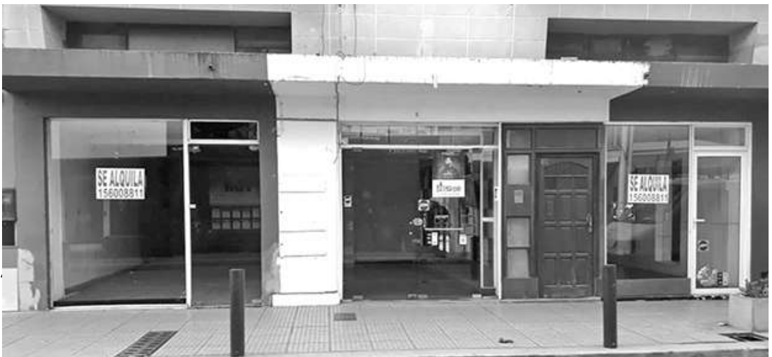
MICROCENTRO: SEGUN EL CECIS, EN 40 MANZANAS HAY 116 COMERCIOS VACIOS.

La preocupación es generalizada. La recesión golpea en cadena: las ventas en comercios cayeron por decimoquinto mes consecutivo, aumentó el número de locales cerrados y la pérdida del trabajo registrado fue el más alto en la era Cambiemos.