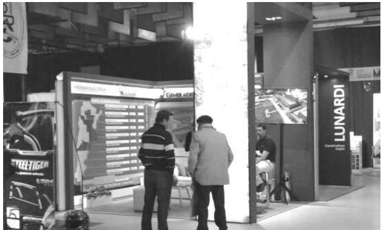
EDICION 2018: EN LA SEGUNDA FERIA ASISTIERON MAS DE 15.000 PERSONAS.

A las 18 será el turno de Jorge Asis, escritor, periodista y analista político.