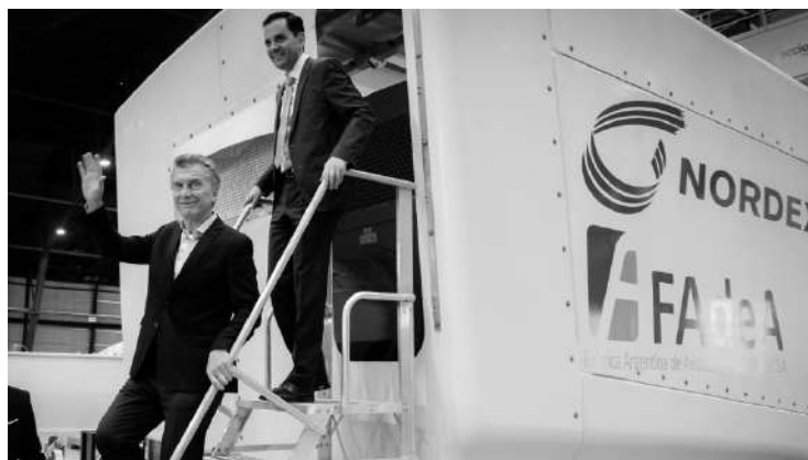
FADEA: MACRI ESTUVO EN LA FABRICA QUE PRODUCIRA AEROGENERADORES.

En la histórica fábrica de aviones, se ensamblarán aerogeneradores para energía eólica. La alemana Nordex Group producirá para la trasnacional AES.