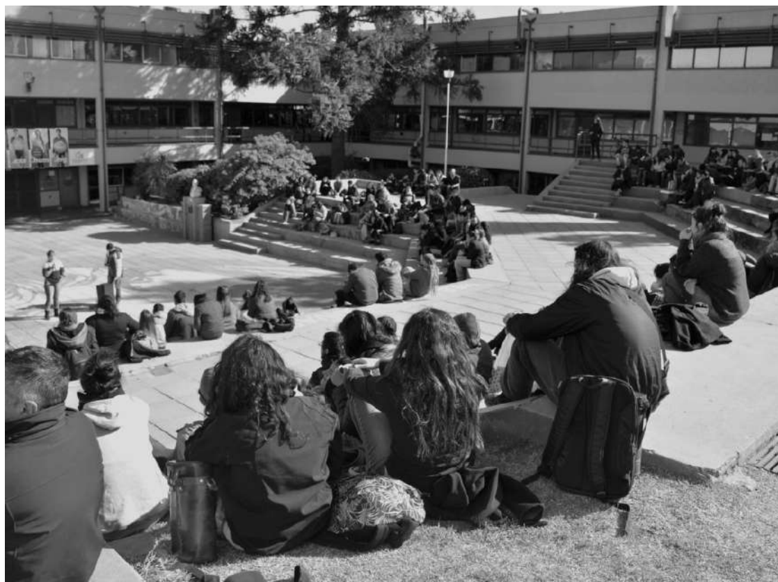
EN EL ANFITEATRO. 250 PERSONAS DEFINIERON ACCIONES.

Expresaron preocupación ante la caída del presupuesto educativo. Definieron el "carácter social" de la asamblea y actividades hacia adelante.