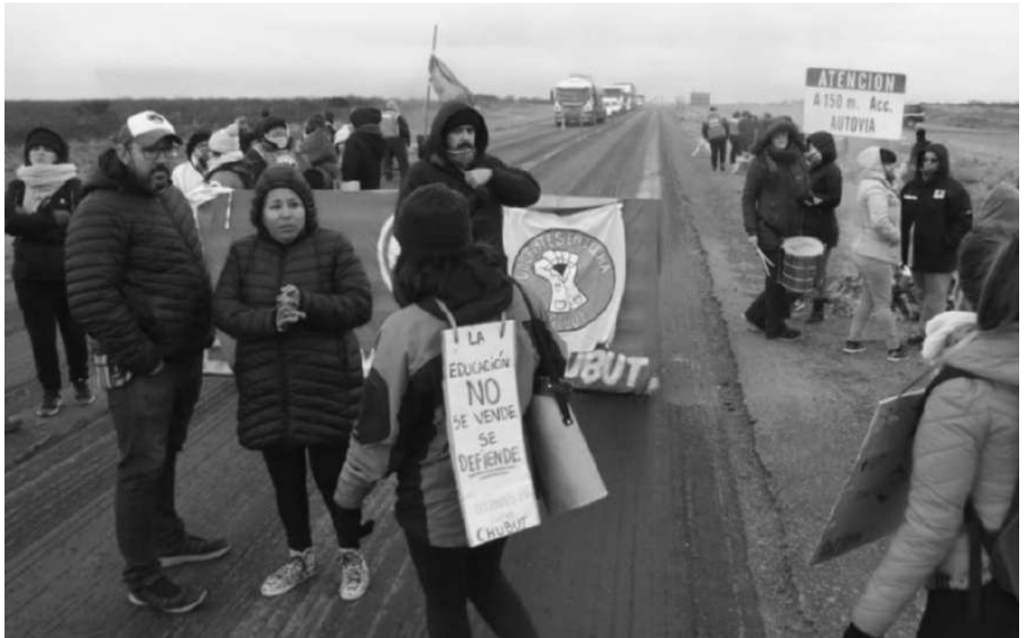
MEDIDAS DE FUERZA. LOS DOCENTES SIGUEN MOVILIZADOS Y SUMAN EL APOYO DE OTROS GREMIOS.