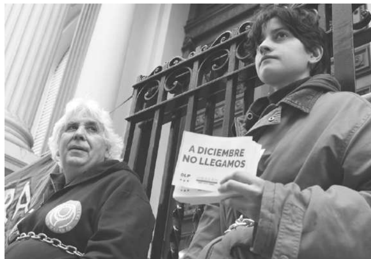
"A DICIEMBRE NO LLEGAMOS".