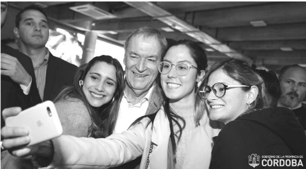
El programa implicará una inversión provincial de 300 millones de pesos.

Seis de cada 10 beneficiarios del Programa de Inserción Profesional, implementado por el gobierno provincial, permanecen en sus puestos luego de los 12 meses de práctica. El gobernador Schiaretti lanzó la segunda edición de la iniciativa con un cupo para 3.000 nuevos profesionales.