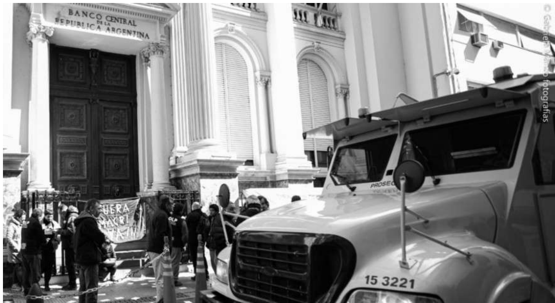
EN EL CENTRAL. EL MIÉRCOLES, PROTESTAS CONTRA LA FUGA DE DIVISAS.

El 95,3 % de las inversiones financieras que ingresaron al país ya se fugaron. Los bancos tienen papeles por 370 mil millones que aún no renovaron. ¿Para ellos la medida?