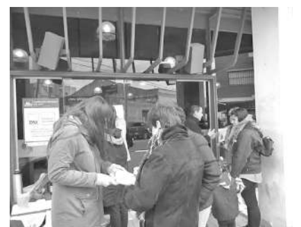
RECLAMO Y JUNTA DE FIRMAS DEL COLECTIVO "NI UNA MENOS" FRENTE A ANSES RIO CUARTO.

Críticas con esto, pero con una firme posición de defensa de los derechos conquistados y frente a la reducción de los alcances del Estado, de sus esferas de participación y sus mecanismos de protección social, desde el Colectivo Ni Una Menos no podíamos no estar acompañándolas en el reclamo por el cobro de su Asignación porque estamos conscientes de la grave situación de emergencia alimentaria que pone en riesgo toda nuestra infancia.