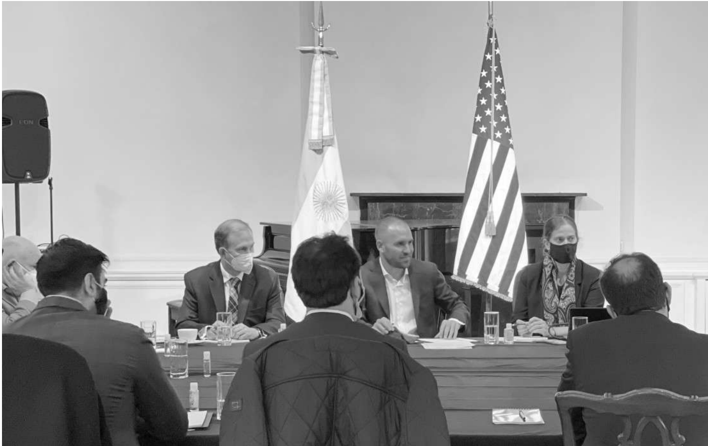
GUZMÁN. 19 DE MARZO DE ESTE AÑO, EL MINISTRO DE ECONOMÍA SE REUNIO CON FONDOS DE INVERSIÓN EN NUEVA YORK.