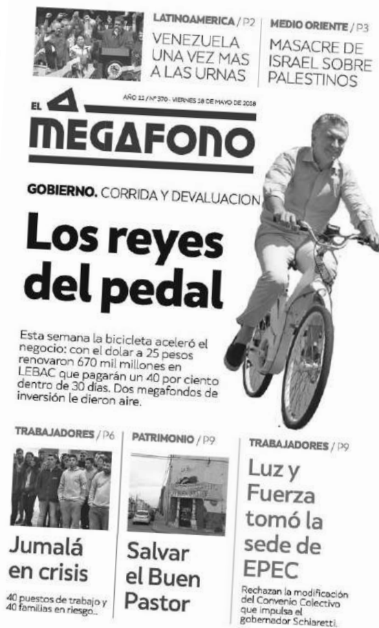
18-05-2018. TAPA "LOS REYES DEL PEDAL"

Por caso de abril a julio de 2019, el ingreso de capitales financieros promedió 925 millones de dólares por mes, mientras que la media mensual de egresos fue de 1.628 millones, según un informe del Observatorio de Coyuntura Internacional y Política Exterior (OCIPEX).