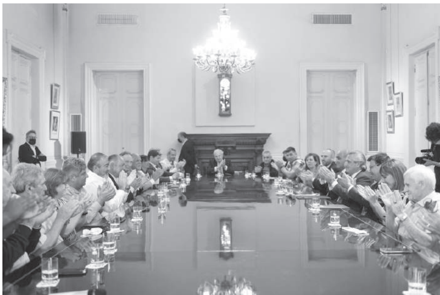
POR CONSENSO. PRESIDENTE, EMPRESARIOS Y DIRIGENTES SINDICALES EN LA MESA.