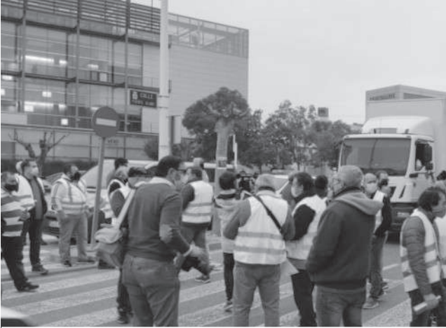
ESPAÑA: TRANSPORTISTAS BLOQUEAN RUTAS.

E ste lunes inició una huelga de transportistas en España, por “la situación económica de quiebra total” del 90 % de las empresas de transporte, debido al alza de los precios de combustibles y por las condiciones laborales “de total precariedad” que sufren. La denominada “Plataforma para la Defensa del Sector de Transporte de Mercancías por Carretera Nacional e Internacional”, representa a los pequeños y medianos transportistas y no forma parte del Comité Nacional del Transporte por Carretera, órgano que delibera las medidas del sector con el gobierno español. La medida ha producido desabastecimientos en supermercados de algunas zonas del país. La nafta y el diésel en España sufrieron aumentos de 9,9% y 15%, respectivamente, en la última semana, situándose a precios históricos récord.