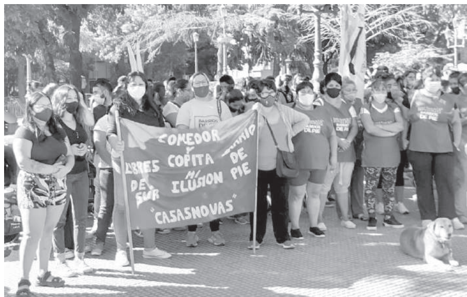
RECLAMO. LA JORNADA NACIONAL DE LUCHA CONTRA LA PRECARIZACION DE LA VIDA, TAMBIEN TUVO LUGAR DE RIO CUARTO. DESDE LOS BARRIOS FUERON A PLAZA ROCA.