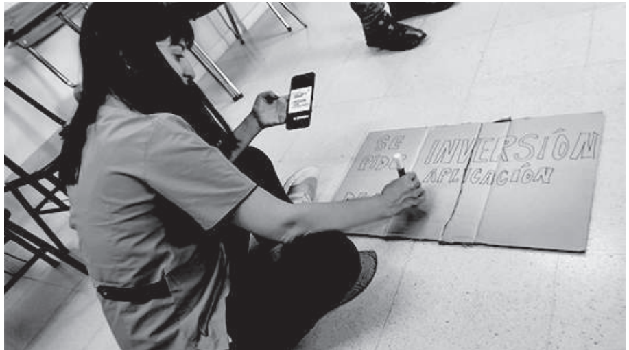
COLECTIVO ORGANIZADOR: LOS TRABAJADORES SE REUNIERON EN EL HOSPITAL PARA PREPARAR LOS CARTELES Y LAS CONSIGNAS DE LA MOVILIZACIÓN.

Esta ley “podríamos decir que es hermana de la Convención Internacional de los Derechos de