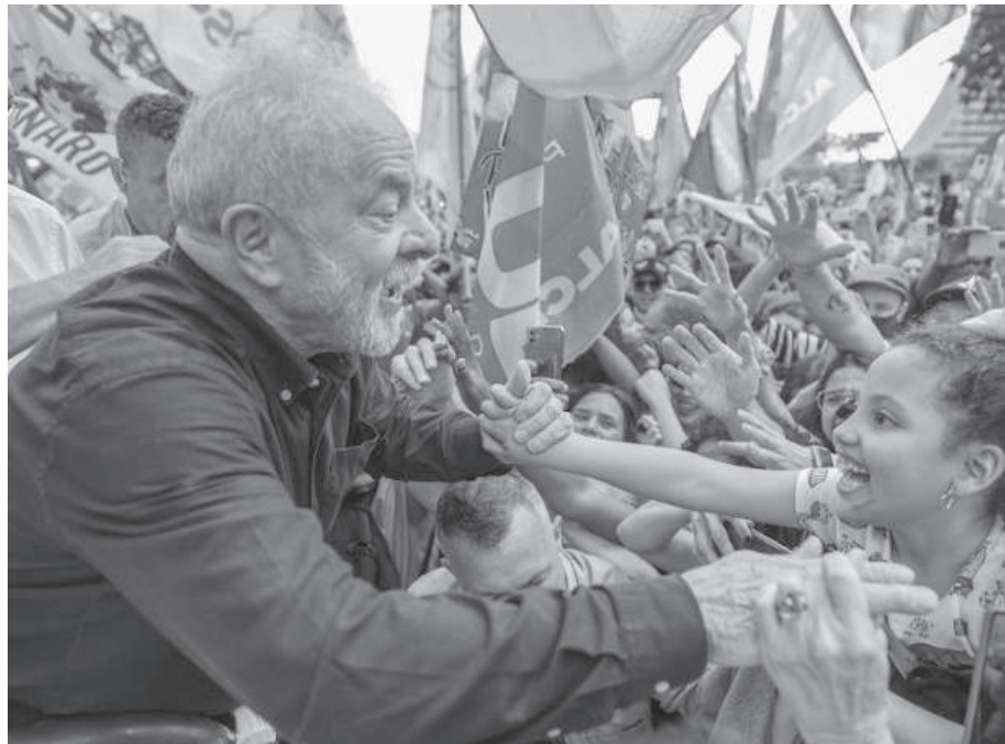
LULA: PRESIDENTE DE BRASIL NUEVAMENTE CON UNA DIFERENCIA MÍNIMA SOBRE SU RIVAL Y ACTUAL PRESIDENTE, BOLSONARO.

retroceso relativo a sus posiciones en el ranking mundial por países y pese a sostener el primer lugar en América Latina y el Caribe por su capacidad de producir bienes y servicios, su posición en el conjunto mundial está en retroceso. De ubicarse entre los primeros siete hace una década, al presente muestra una pérdida de varios lugares, relegando posición entre los primeros 12. Argentina arrastra problemas estructurales por largo tiempo, agravada con sus elevados datos de inflación que la colocan entre los más altos de la región y del mundo.