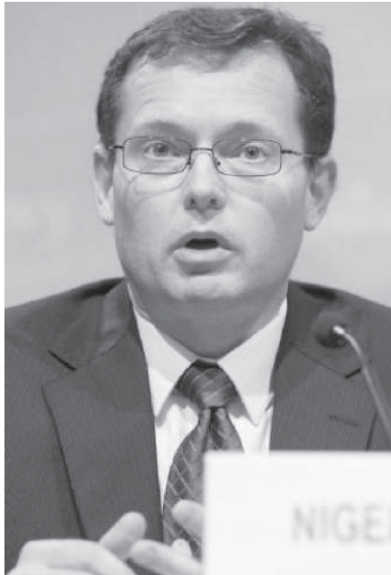
CHALK: DIRECTOR EN REEMPLAZO DE ILAN GOLDFAJN, CON LICENCIA POR CANDIDATEARSE AL BID.

Sobre las correcciones de las tasas de interés de países como Estados Unidos, el FMI sostiene que “es