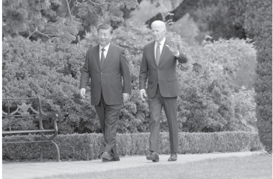
ESTADOS UNIDOS. LA REUNION EN SAN FRANCISCO ENTRE LOS DOS MANDATARIOS.

interfiera en el libre comercio mundial.