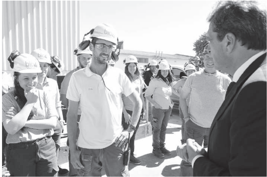
BIO 4. MASSA JUNTO A LOS TRABAJADORES DE LA EMPRESA UBICADA EN RIO CUARTO.

AGD es una de las integrantes de Cámara Argentina de Biocombustibles (CARBIO). Allí también participan Bunge, Cargill, Molinos Río de la Plata, Dreyfus, Vicentin, Explora, Noble Argentina, Renova, Unitec Bio. La mayoría de estas empresas, como se señaló en este informe, concentran en volumen el comercio exterior en la Argentina.