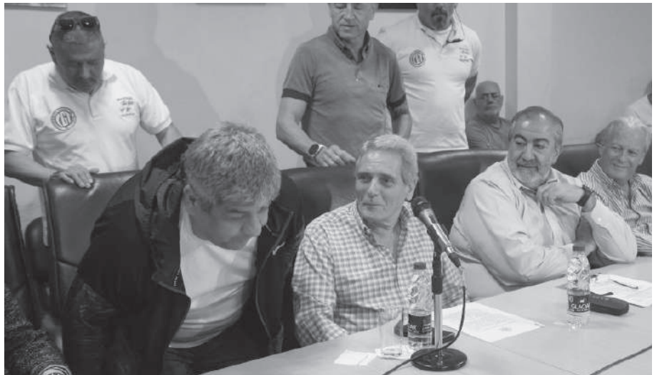
ACUERDO. EL CONSEJO DIRECTIVO EN PLENO ACUERDO.

las y los trabajadores, con el objetivo de mejorar la productividad y la competitividad del sistema de producción”; e “instrumentar la participación gremial en políticas de vivienda para asegurar las necesidades de los trabajadores”. La “Argentina se reconstruye sobre la base del Trabajo y la Producción, con un Estado fuerte regulando y planificando una economía basada en la recuperación de nuestro enorme potencial industrial” asegura la Corriente Federal de los Trabajadores. Agrega que con la victoria del oficialismo “aspiramos a la constitución de un Gobierno capaz de hermanar en una sola y poderosa fuerza y en torno a la defensa del legítimo derecho a la autodeterminación, a todos los sectores nacionales que tienen como interés común las banderas de la independencia Económica, la Soberanía y la Justicia Social”.