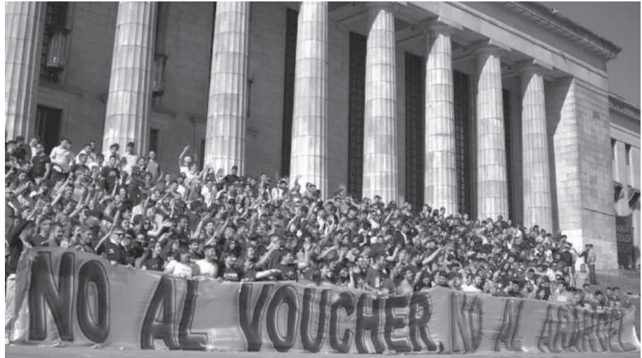
UBA. EN LA FACULTAD DE DERECHO ESTUDIANTES REALIZARON EL RECLAMO.

El sistema de vouchers para el acceso a las instituciones educativas en sus distintos niveles, se enmarca dentro de un paradigma educativo conocido globalmente como free choice (elección libre) que se encuentra vigente en países como Holanda desde principios del siglo XIX. La lógica de este sistema se monta sobre dos principios: la “libre” elección de la familia para matricular a sus hijos en la escuela de su predilección, y la competencia entre instituciones para promover la efectividad de las más demandadas. Son pocos los países en el mundo donde se sostiene este sistema, siendo Suecia el caso más emblemático. En Nueva Zelanda y Holanda hay experiencias con algunas similitudes, mientras que Colombia y Chile son los casos