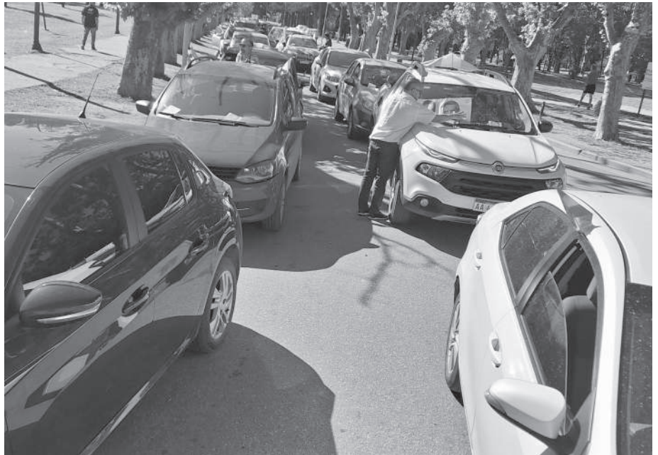
PARQUE SARMIENTO: LOS AUTOS SALIERON DESDE BANDA NORTE, RECORRIERON SECTORES DEL CENTRO, PASARON POR BARRIO ALBERDI Y FINALIZARON EN PALZA SAN MARTIN.

Los autos con banderas argentinas y afiches de la fórmula Unión por la Patria (UxP) se convocaron en el Anfiteatro municipal de Banda Norte, recorrieron la calle Estados Unidos, luego Marcelo T. de Alvear y por Avenida España hasta el centro de la ciudad. Con bocinazos y algunos carteles en defensa de la