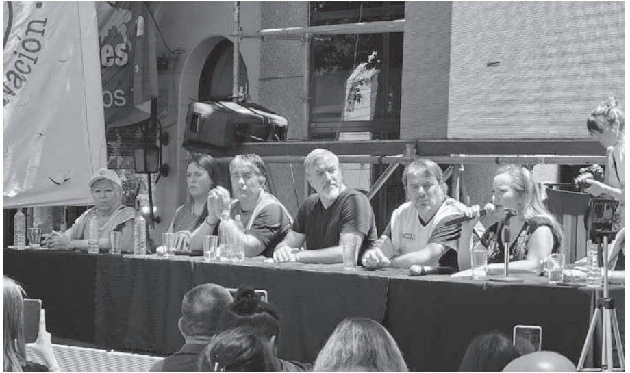
CONFERENCIA. AGUIAR Y CATALANO DE CAPITAL EN EL ACTO.

“Respetamos la voluntad popular pero tenemos la obligación de