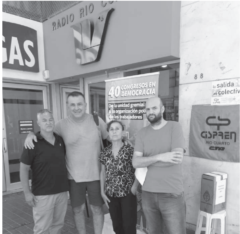
LV16. NO DEJARON QUE LA URNA ESTE DENTRO DE LA RADIO. SE VOTO EN LA PUERTA.

Pero además, el dirigente indicó que está habiendo “incumplimientos del pago de salario, pagos en cuotas, con