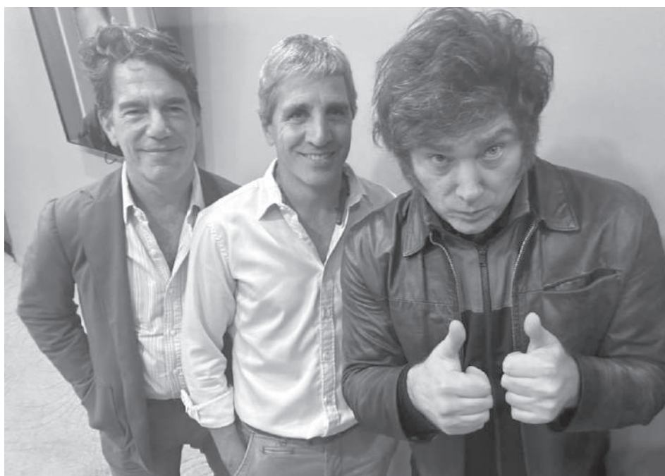
FOTO ANTES DE VIAJAR. POSSE, CAPUTO Y MILEI ANTES DE IR A EEUU.

En el ministerio de Economía y el Banco Central de la República Argentina (BCRA), fueron poniendo y sacándose el traje de funcionarios varios dirigentes. Pero la pulseada la ganó Luis "Toto" Caputo, quién irá a la cartera de Economía y acompañó a Milei en su viaje a EEUU. Fue ministro de Finanzas y presidente del Banco Central de la República Argentina durante el gobierno de