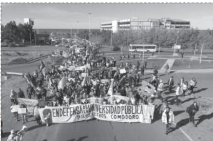
COMODORO RIVADAVIA. 3.000 PERSONAS.