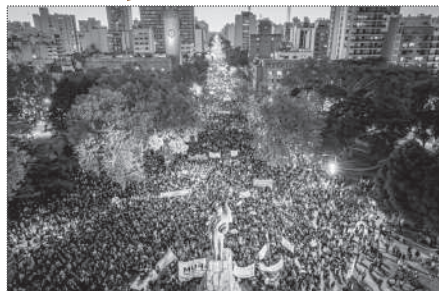
MAR DEL PLATA. 20.000 PERSONAS.