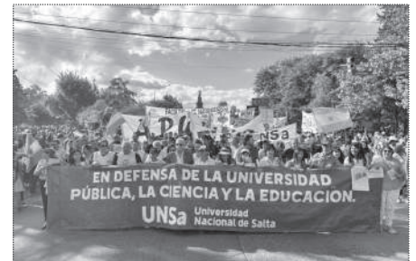
SALTA. 20.000 PERSONAS.

marzo y mayo y una partida extraordinaria para los hospitales universitarios.