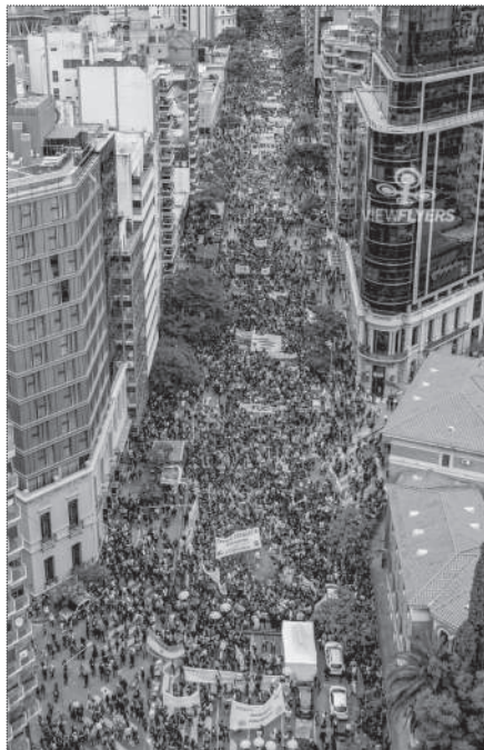
CORDOBA. 100.000 PERSONAS.

Días antes, desde el Ministerio de Capital Humano, el gobierno nacional buscó apagar el conflicto comunicando oficialmente un “acuerdo” con las universidades, brindando un 70% de aumento de los gastos de funcionamiento en