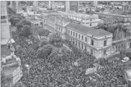
SANTA FE. 30.000 PERSONAS.