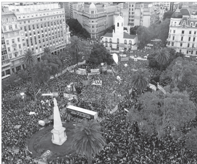
BUENOS AIRES. MÁS DE 500.000 PERSONAS.