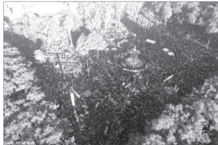
ROSARIO. 100.000 PERSONAS.