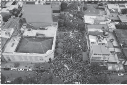
CORRIENTES. 10.000 PERSONAS.