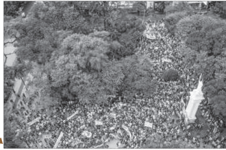
POSADAS. 3.000 PERSONAS.