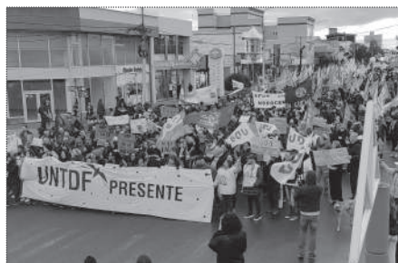
USHUAIA. 15.000 PERSONAS.

promedió el medio millón de asistentes, luego la estimación superó las 700.000 personas.