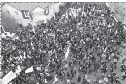
RÍO GALLEGOS. 6.000 PERSONAS.