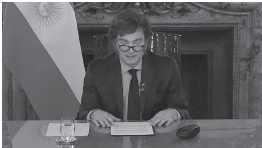
CADENA NACIONAL. MILEI ANUNCIO SUPERAVIT FISCAL COMO PIDE EL FMI.

Se trata de la cuarta baja de tasas y la segunda en un mes que aplica la actual gestión de BCRA. En diciembre del 2023 el índice de referencia de la política monetaria se encontraba en el 133% y era el de las Letras de Liquidez (LELIQs). La actual gestión dispuso que pasara a ser la de pases y comenzó a recortarla hasta el nivel actual del 60%.