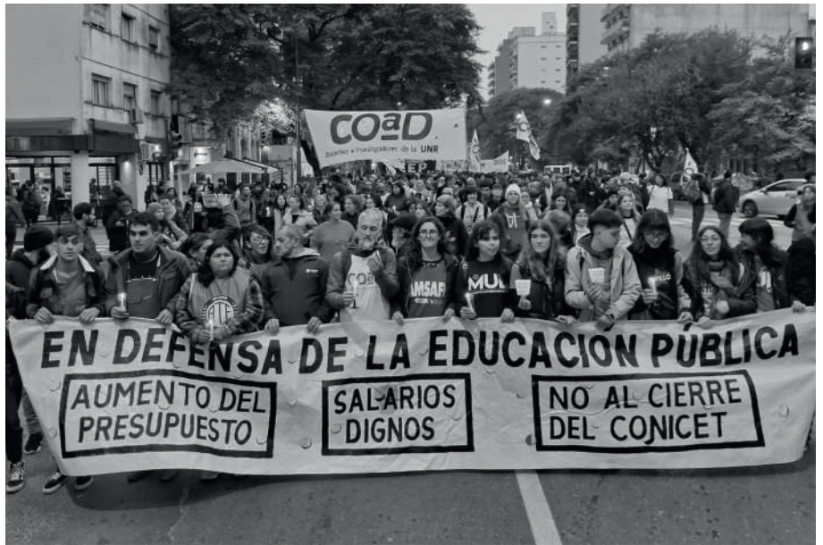
ROSARIO. MARCHA DE ANTORCHAS DE LOS GREMIO EDUCATIVOS.

La sesión, fuertemente cuestionada por los diputados de La Libertad Avanza y el PRO, fue resistida en la previa por el oficialismo: para desarticularla, prometieron convocar directamente al plenario de comisiones y comunicaron a través del vocero presidencial “un acuerdo con el Consejo Interuniversitario Nacional (CIN, el plenario de universidades) que va a permitir dotar a las Universidades de recursos, en términos de gastos de funcionamiento, que todos entendemos que son los necesarios”. “La idea es que finalmente terminemos con la discusión o con el desacuerdo que había en términos presupuestarios” dijo y cifró el aumento “en torno al 270%”. “Esto se va a estar