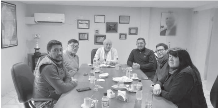
“LA PATRIA NO SE VENDE”. REUNION DE LOS DIRIGENTES DE LAS CGT DE CORDOBA.

A la convocatoria del movimiento obrero, se le sumarán distintas