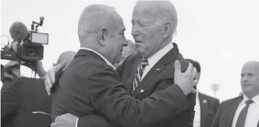
ACUERDOS. EL PRIMER MINISTRO ISRAELI NETANYAHU Y EL MANDATARIO DE EEUU, BIDEN.

La Fiscalía del Tribunal de La Haya solicitó este lunes una orden de detención para Hamas, Netanyahu y otros funcionarios. Mientras, el ejército israelí mantiene bombardeos y combates en Ráfah.