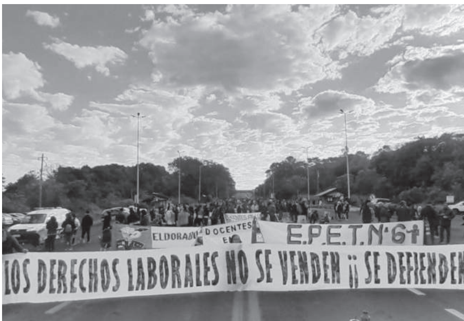
CORTE. Uno de los más de 20 cortes de ruta en Misiones.

“Necesitamos una recomposición superior al 100% para alcanzar la canasta básica”, sostuvo el efectivo.