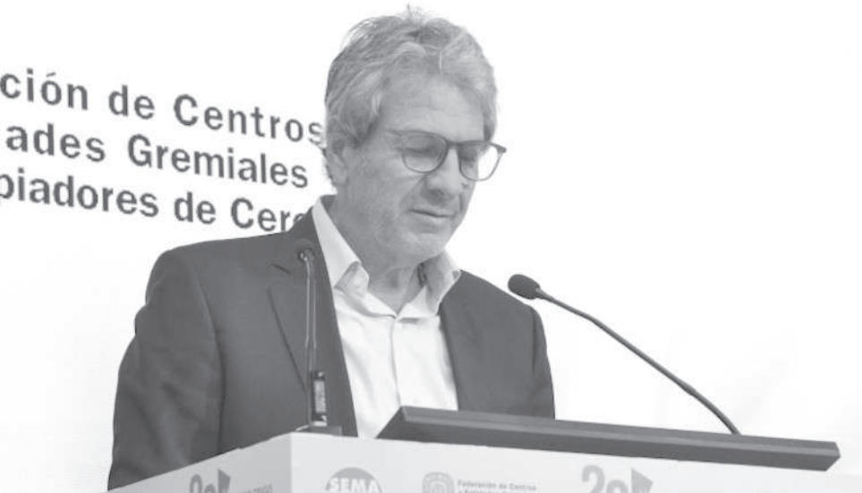
PAZO: "NUESTRO PROGRAMA SE BASA EN GENERAR COMPETITIVIDAD SISTÉMICA".

dólares. Y cada uno intenta resolver su problema en el otro porque todos están sometidos, de una manera o de otra, al estado del arte: el condicionamiento que impone la Reserva Federal (FED) de EEUU a todo el mundo con su política de guerra de centralización monetaria.