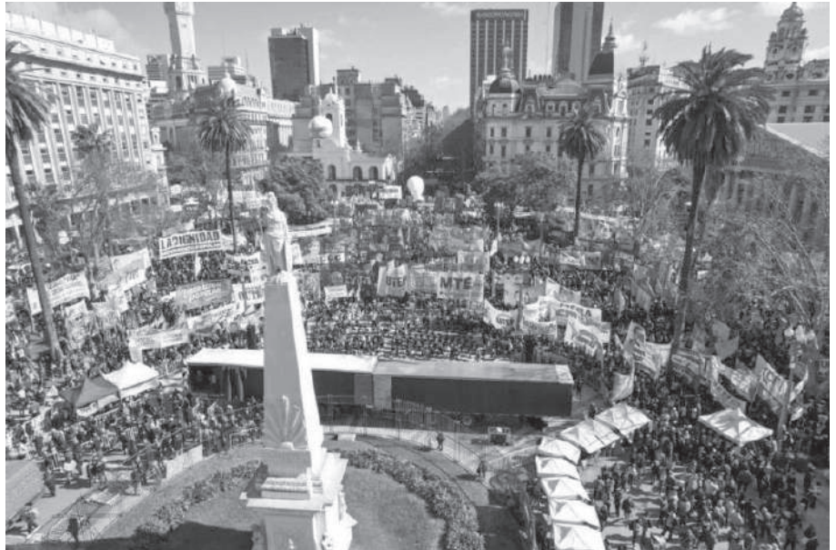
PARA GRAMAJO, DE LA UTEP, EL GOBIERNO “HA DECIDIDO DECLARARLE AL GUERRA A TODO EL PUEBLO ARGENTINO”.

“Nuestro compromiso es con todos los trabajadores, con los que tienen la suerte de estar en la formalidad y los que desgraciadamente están en la informalidad y todos los días se la tiene que rebuscar para llevar