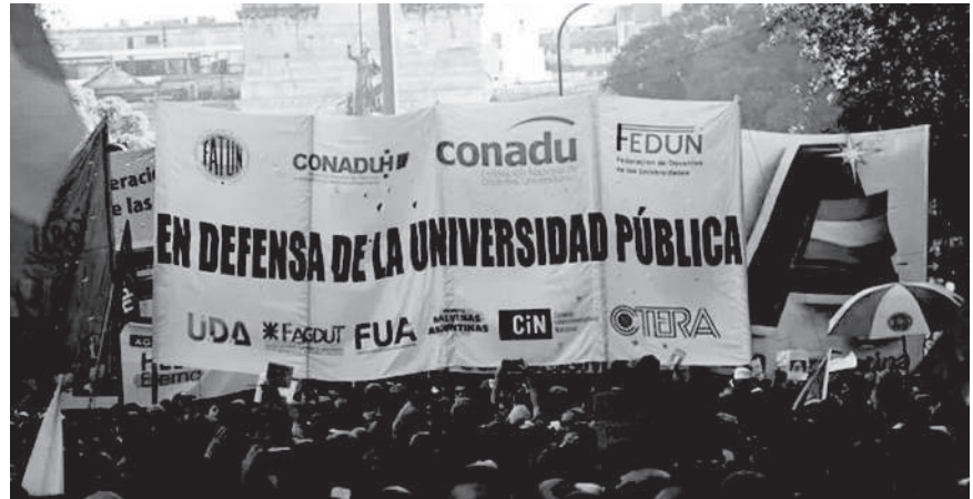
COMUNIDAD UNIVERSITARIA. SINDICATOS EMPUJAN OTRA MOVILIZACIÓN.

El Frente Sindical Universitario definió fechas de protesta y los gremios locales preparan su agenda.