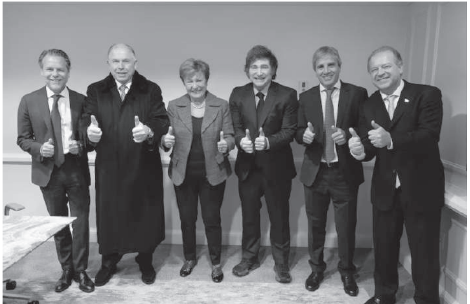
EN ESTADOS UNIDOS. MILEI Y SU EQUIPO JUNTO A LA DIRECTORA DEL FMI.