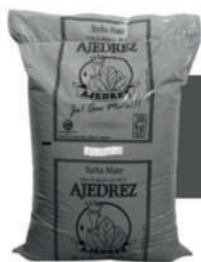
Yerba canchada Ajedrez

Ya iniciado el ingreso universitario y a días de comenzar la actividad en los colegios, estudiantes reclaman a la Provincia para poder utilizar el Boleto Educativo desde Febrero a Diciembre.