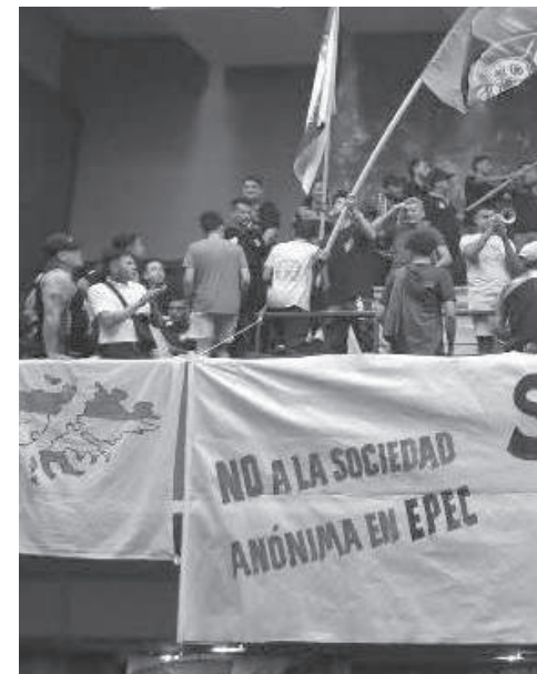
UNIDAD. CENTRALES DE CGT Y CTA, ESTUDIA

El rechazo de los trabajadores es porque “no solo tarde o temprano van a avanzar en el patrimonio de los