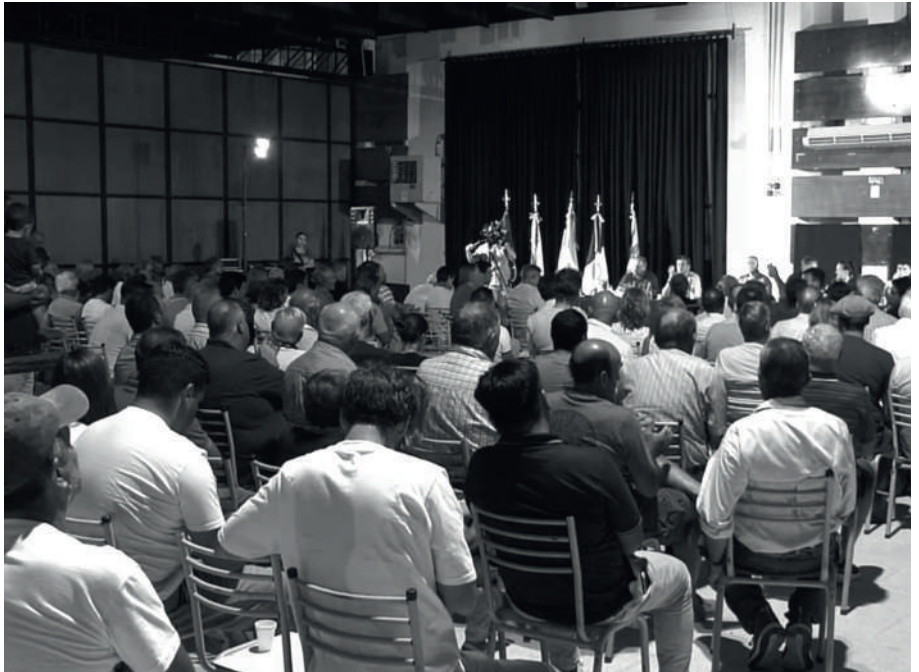
ASAMBLEA. SE REALIZO ESTE LUNES EN LA SEDE LOCAL DE LA RURAL

Previo a la Asamblea, la Rural de Río Cuarto había circulado un documento titulado: “Los costos de la mentira que siempre termina pagando el que produce”. “Es fácil pedir la quita de retenciones a la producción agropecuaria para después poder lucrar con ese rédito”, inicia el escrito, que cuestiona los