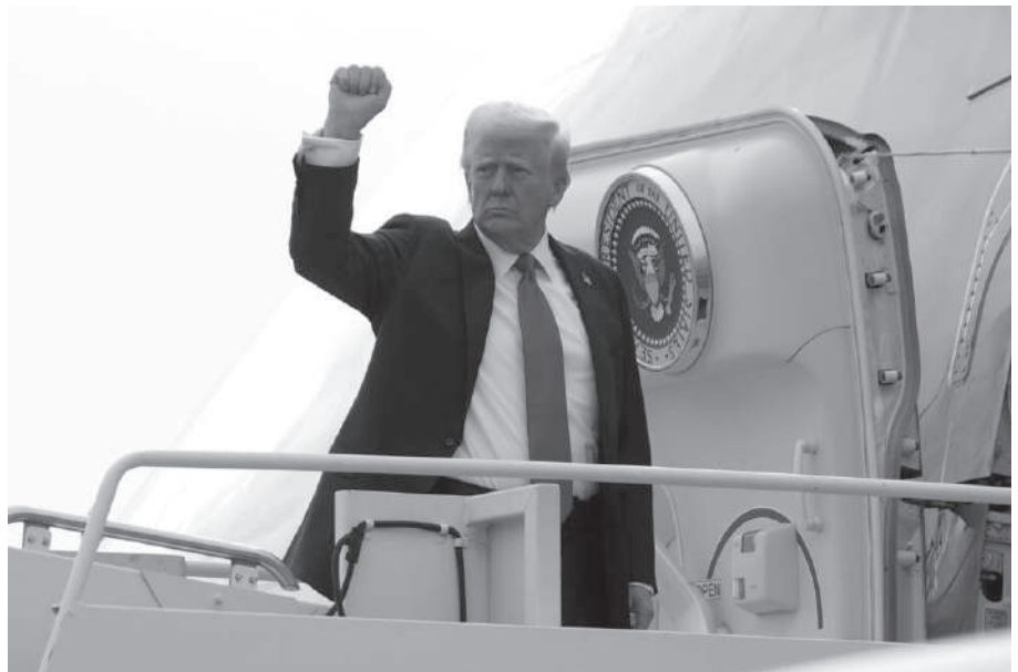
MEDIDAS DE TRUMP. INDUSTRIALES ARGENTINOS PIDEN LA INTERVENCION DE MILEI.

Ya un informe de la Bolsa de Comercio de Rosario del año 2022,