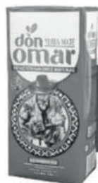
Yerba Don Omar