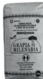
Yerba Grapia Milenaria