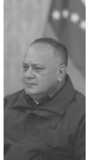
AUTORIDADES. RODRIGUEZ, MADURO Y CABELLO.

afrontando una nueva crisis energética. España sigue en la nómina de países destinatarios. En repudio a la medida, la vicepresidenta y ministra de Hidrocarburos de Venezuela, Delcy Rodríguez, consideró que "Estados Unidos ha tomado una decisión lesiva e inexplicable al anunciar sanciones contra la empresa estadounidense Chevron, pretendiendo hacerle un daño al pueblo venezolano, cuando en realidad se está infligiendo un daño a Estados Unidos".