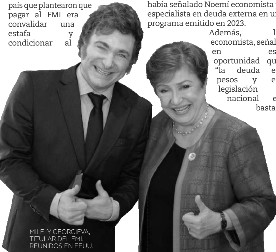
MILEI Y GEORGIEVA, TITULAR DEL FMI. REUNIDOS EN EEUU.

La tendencia es global. Según Fortun, el desempeño de los bonos gubernamentales locales de mercados emergentes se mantuvo sólido en enero y los índices generales que siguen estos mercados registraron un rendimiento del 2,8%. Las ganancias fueron respaldadas por un alto “carry” (bicicleta financiera), la mejora de las condiciones fiscales en economías seleccionadas y la continua demanda de deuda en moneda local por parte de los inversores a pesar de los riesgos cambiarios.