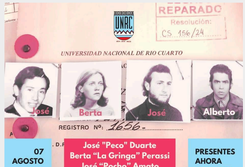
Anterior restitución de legajos

Este viernes 21 de marzo, a las 10:00 horas, en el Aula Mayor "Peco" Duarte, se realizará un nuevo acto de restitución de legajos, en este caso, de exalumnos víctimas sobrevivientes del terrorismo de Estado.