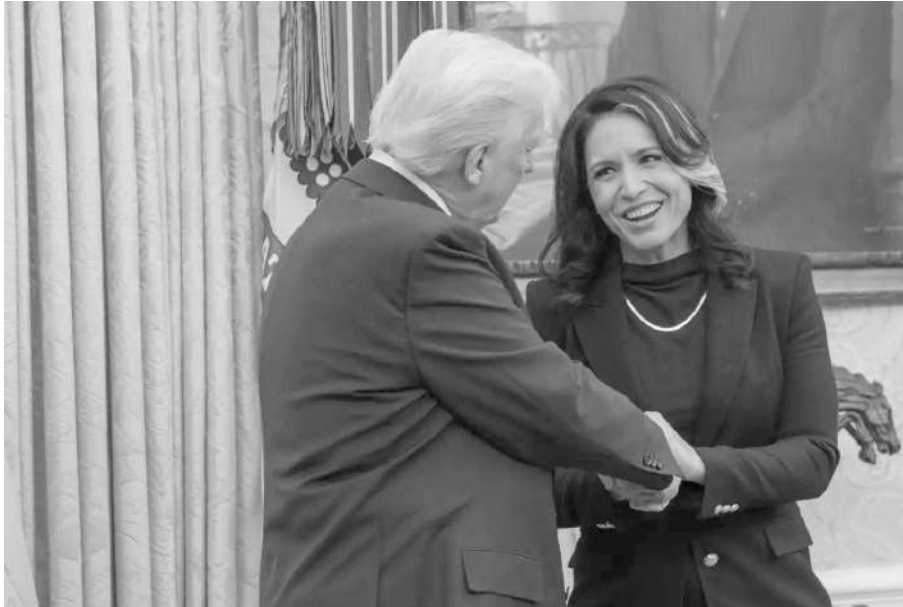
ESTRATÉGICO. DONALD TRUMP NOMBRA A TULSI GABBARD, EX DEMOCRATA.

De Taiwán a Groenlandia, es la principal amenaza para la influencia de EEUU en el mundo. El documento es la base de las decisiones tomadas por Trump.