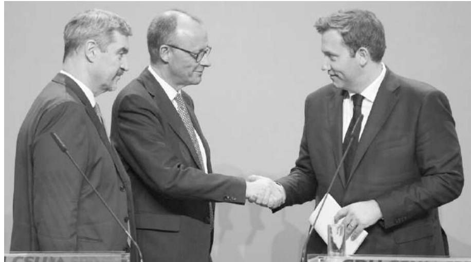
COALICION. LAS TRES FUERZAS DEL NUEVO GOBIERNO, CON MERZ EN EL CENTRO.

La iniciativa fue introducida por la alianza que triunfó en los recientes comicios de febrero: la Unión, conformada por Unión Cristianodemócrata (CDU) y la Unión Social Cristiana de Baviera (CSU). Antes de las elecciones rechazaban asumir nuevas deudas y es uno de los motivos que desbarrancó el gobierno de coalición liderado por Olaf Scholz, del Partido Socialdemócrata (SPD), La Izquierda y Los Verdes. Ahora, apuntan que la situación geopolítica ha cambiado: apremian la economía que no despega, el conflicto abierto en Ucrania y las nuevas políticas exteriores de EEUU con Donald Trump en la presidencia y el Partido Republicano dominando