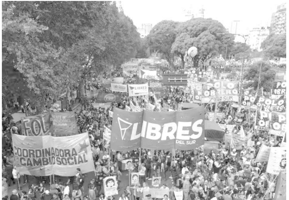
MOVILIZACIONES. LAS ORGANIZACIONES PRESENTES EN CABA, ROSARIO Y CÓRDOBA.

En el diagnóstico de la situación aseguran que “desde el Estado promueven un brutal ajuste que recae sobre los hombros del pueblo trabajador, los estudiantes y los jubilados, y todo ello para poder pagar la deuda pública, que no es más ni menos que el programa económico implementado para que